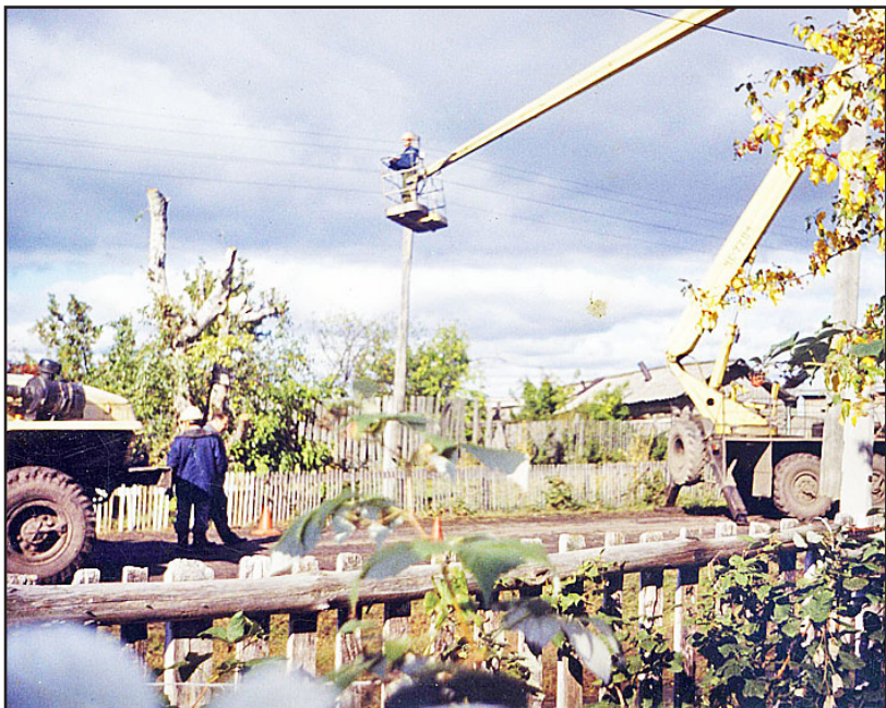
Замена электролинии в Малых Ярках. 2005 год