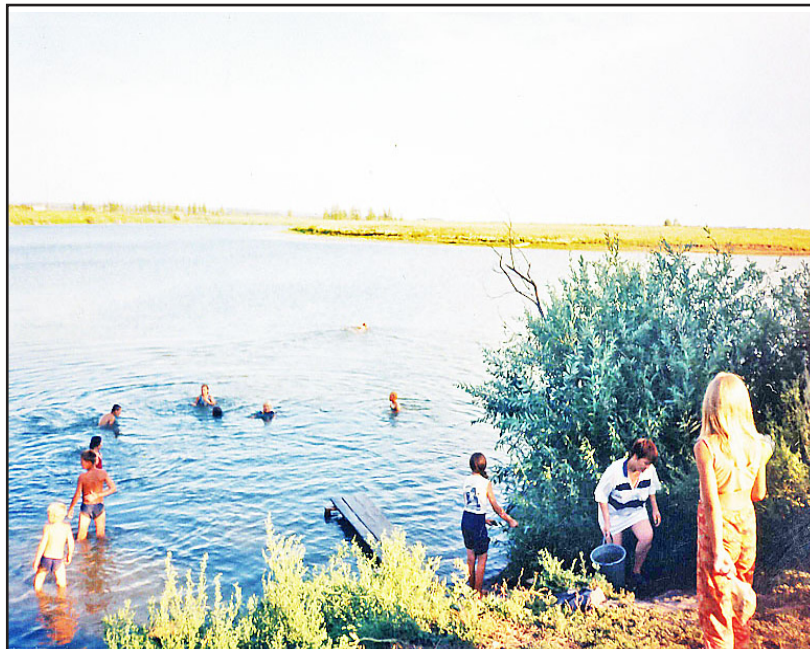
Деревенский пляж на реке Алабуге – любимое место детворы и взрослых