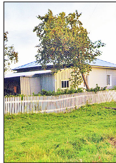
Усадьба Куроптевых. Малоярковцы стараются содержать придомовую территорию в чистоте и красоте