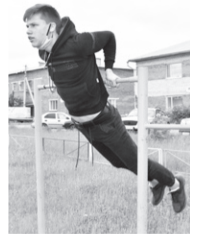
|| Фото автора

Есть у парня успехи и в других областях. Например, в военно-патриотической игре «Зарница» Виктор стал обладателем первого места в личном первенстве по стрельбе из пневматической