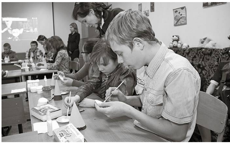
* Творческий мастер-класс

Форум состоял из двух секций. Для детей прошли театрализованное представление «Другая мама», кружок «Юный театрал», подготовленные коллективом ДДТ «Галактика».