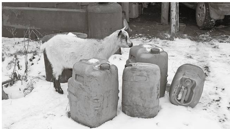
* Запас бензина имеется