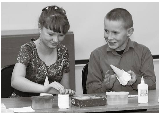
* Делаем игрушки