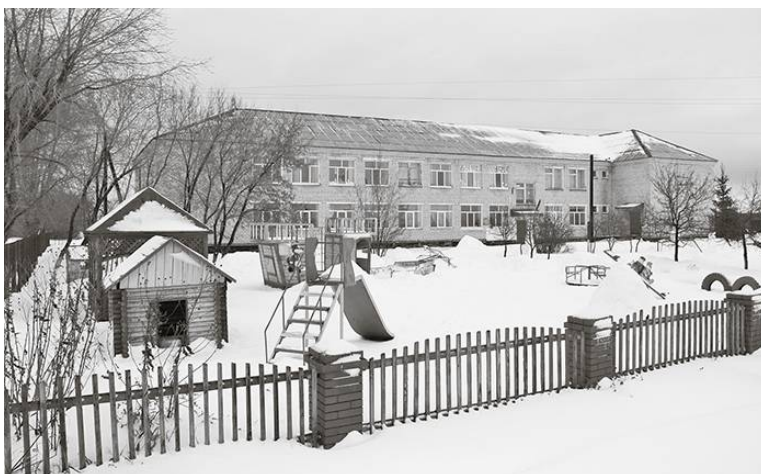
* Территория местной школы