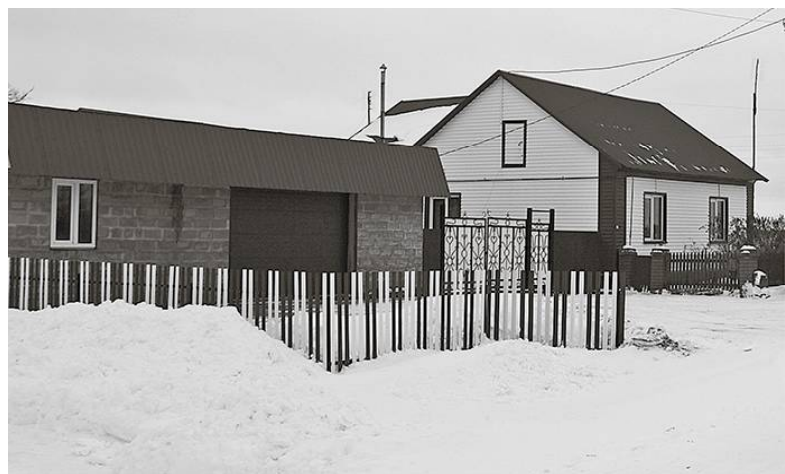
* Вот такие красивые дома в Лопазном

Беседу вела Елена ДАНИЛЬЧЕНКО