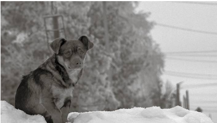
* «Сейчас сосед заправится, в город махнём!»

В магазине «ТРИ СЕЗОНА» новое поступление зимнего товара для всей семьи по старым ценам. Возможен расчёт по карте.