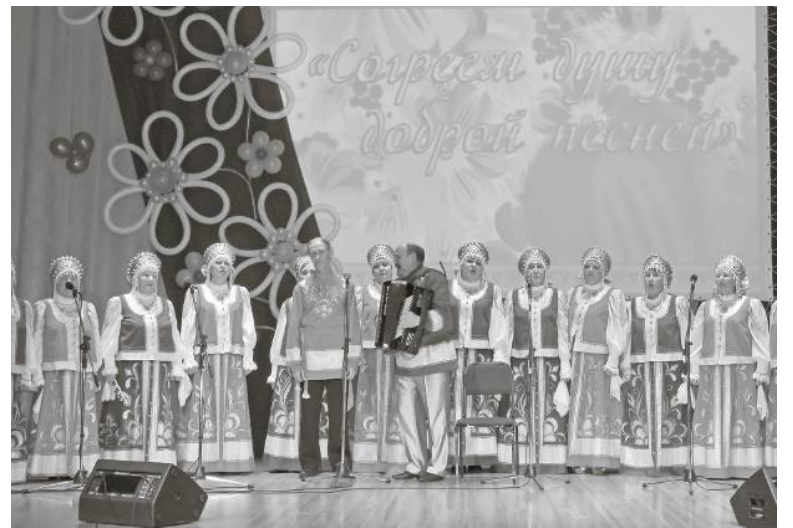
* Хор «Русская песня»