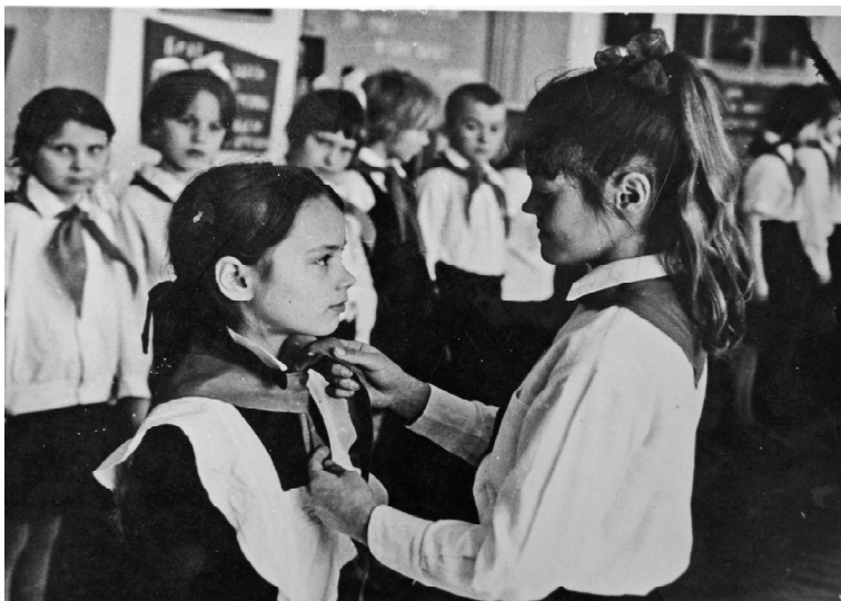
➤ 1971 год, на торжественной линейке в День пионерии – завязывание красных галстуков лучшим ребятам школы.

1987 год. Нашей стране исполнилось 70 лет. В августе 1987 года собрались делегаты