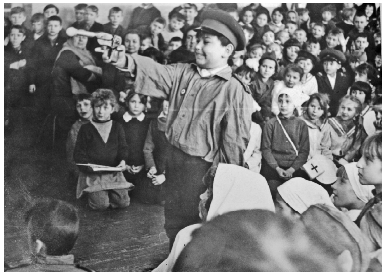
➤ Слёт книголюбив района.