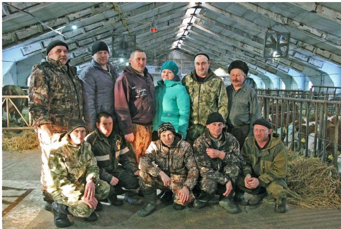
➤ Коллектив молочного комплекса ООО «Радиус-агро»

По сравнению с прошлым годом, поголовье скота увеличилось на 50 голов. Валовой надой составил 5 800 литров на голову. Привес молодняка составляет – 900-950 граммов в сутки. Как отметил Николай Владимирович, это неплохие показатели. Выход телят за 2018 год составил 69%. Здесь заведующий подчеркнул, что ранее выход составлял 53%. Рост есть, и это радует. Тем не менее, эта цифра, по его словам, могла бы быть выше, и главную причину в том, что она такова в настоящее время, он видит в недостаточной сбалансированности питания скота. Хотя корма ООО «Радиус-агро» заготавливаются своими силами, т.к. имеет большие площади сельхозугодий, на ко-