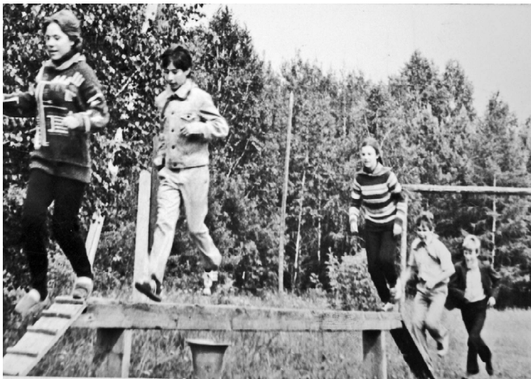
➤ Игра «Зарница», туристическая полоса препятствий.