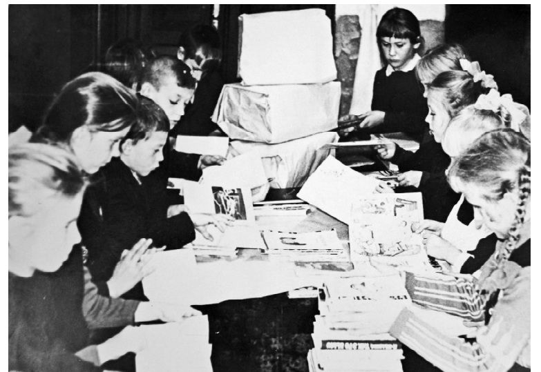
➤ В пионерской комнате идёт сбор посылок для отправки детям.

У октябрят закончилось путешествие в страну «Пионерию». На груди расцвели красные галстуки. Запомнилась знаменитая встреча в этом году у пионеров с Девя-