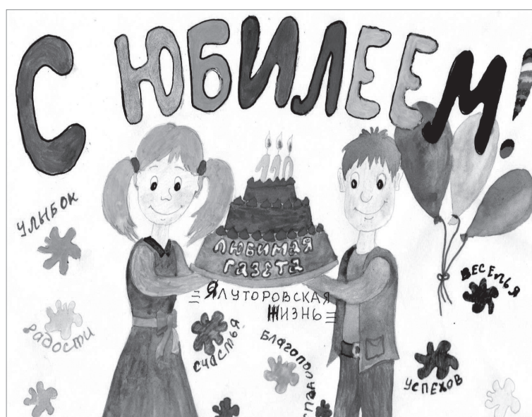
Вика Ильина с мамой, 5 лет