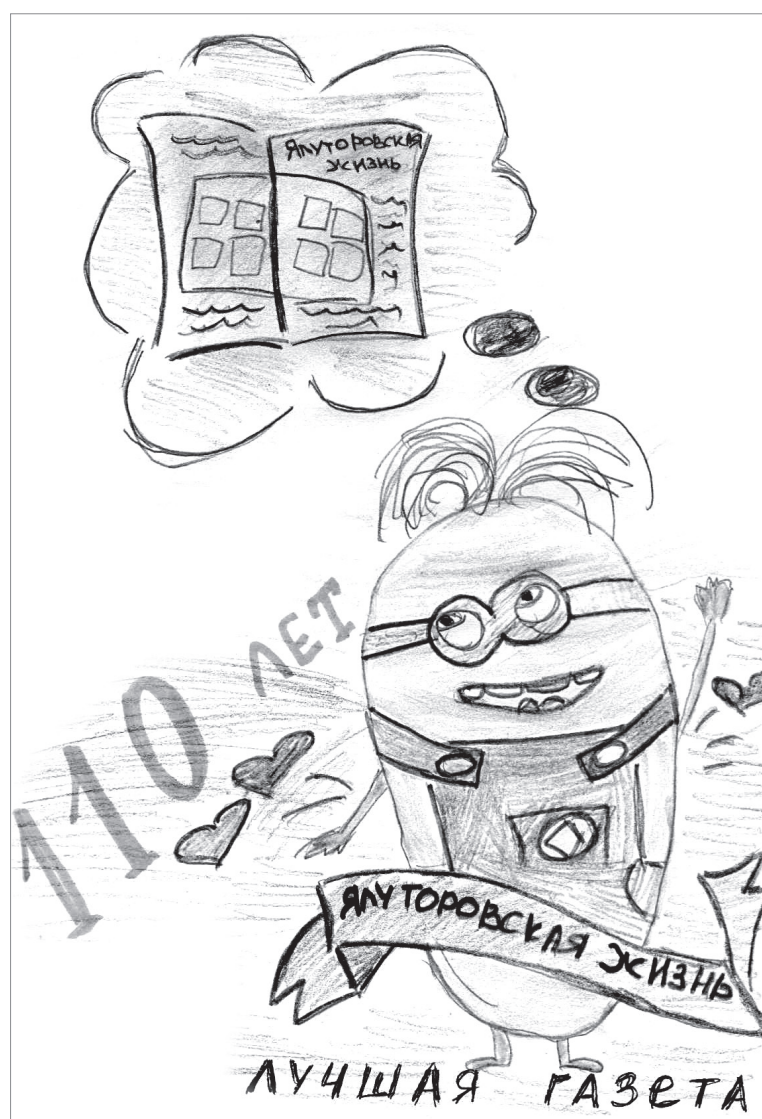
Вероника Боровинская с родителями, 5 лет