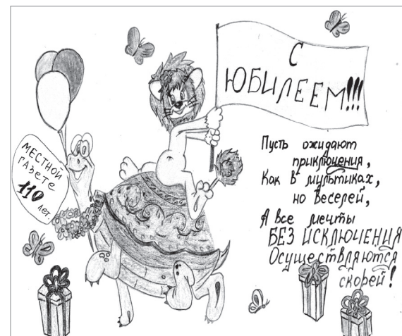
Влад Нижник с мамой, 6 лет