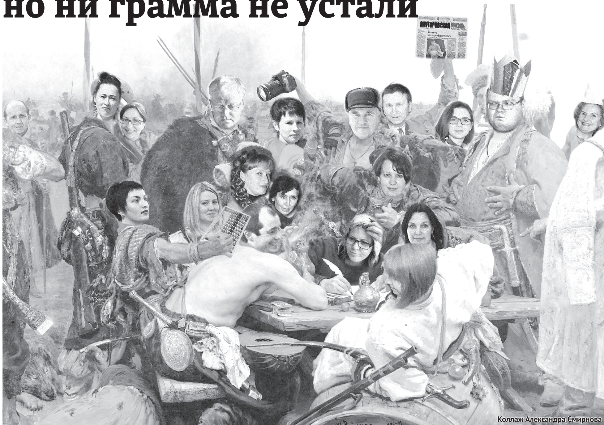
Коллаж Александра Смирнова