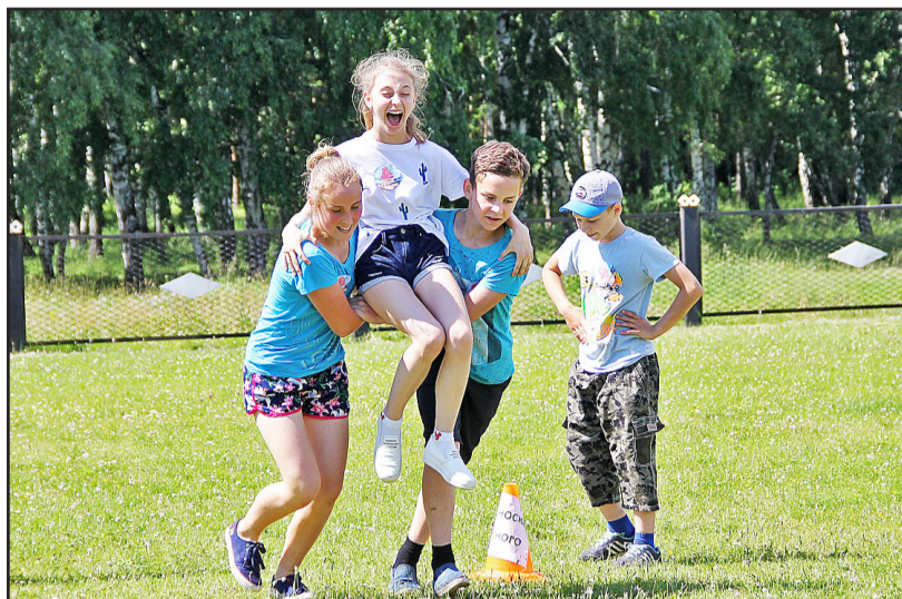
Члены цирковой команды «Алые паруса» на этапе «Переноска раненого» показали свою выносливость, быстроту и физическую силу

Педагоги, приехавшие на «Зарницу», помогали ребятам и искренне надеялись на победу. Некоторые