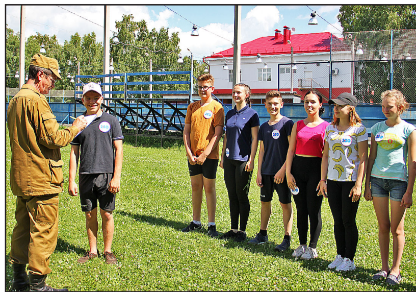
Командный дух и бодрое настроение обеспечили ребятам из Казанской детско-юношеской спортивной школы победу в игре

сказал, что к конкурсу ребята практически не готовились, но, поскольку участвуют в «Зарнице» не впервые, сложностей у ребят не должно быть. Команда «Октябрят» из