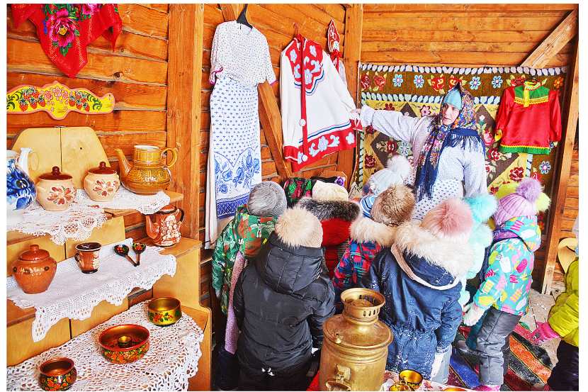
Музей предметов русского быта открылся в детском саду «Ивушка» на уличной веранде

В итоге получился настоящий музей, в котором собраны предметы