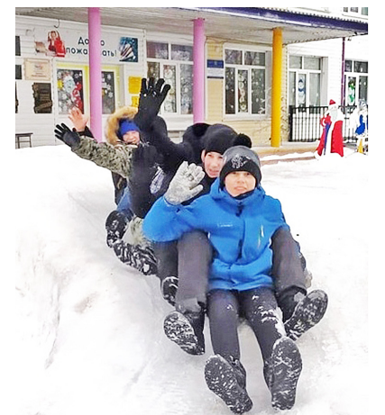
Кататься с горки любят дети в любом возрасте

Позабыв про телефоны и компьютеры, девчонки и мальчишки классно провели время на свежем воздухе: много бегали, устраивали чехарду, шутили и смеялись. А затем, по сложившейся уже традиции, все вместе пили горячий чай из