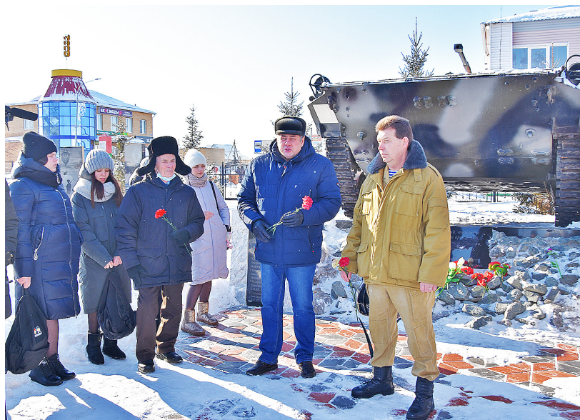
Каждый, кто выступал на митинге, говорил о мужестве и героизме советских солдат