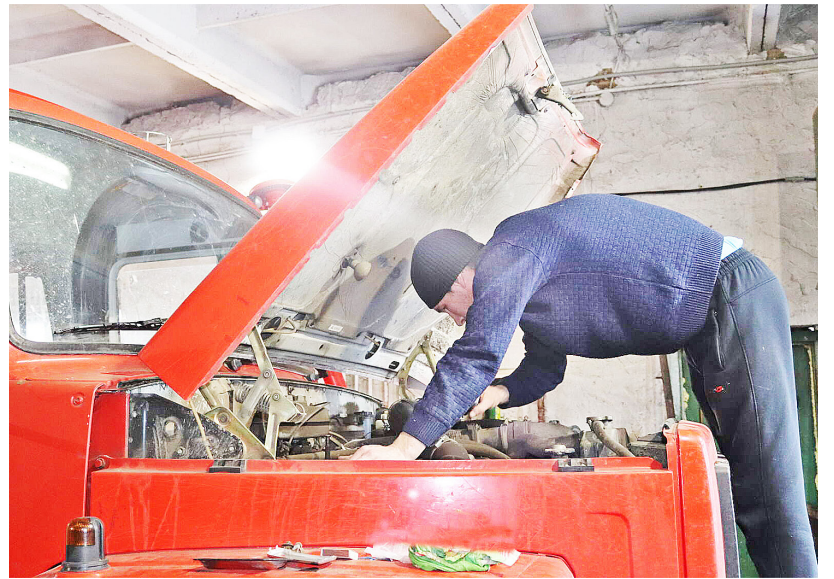
Время позволяет качественно подготовить лесопожарную технику

Как отметил губернатор Тюменской области Александр Моор, в 2021 году в регионе в борьбе с лесными пожарами был задействован сильный и профессиональный состав огнеборцев. Они получили колоссальный опыт, поэтому в теку-