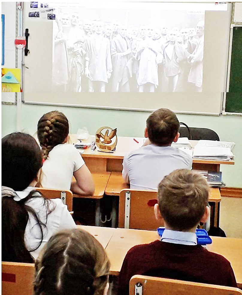
Тематический урок о трагедии холокоста взволновал школьников