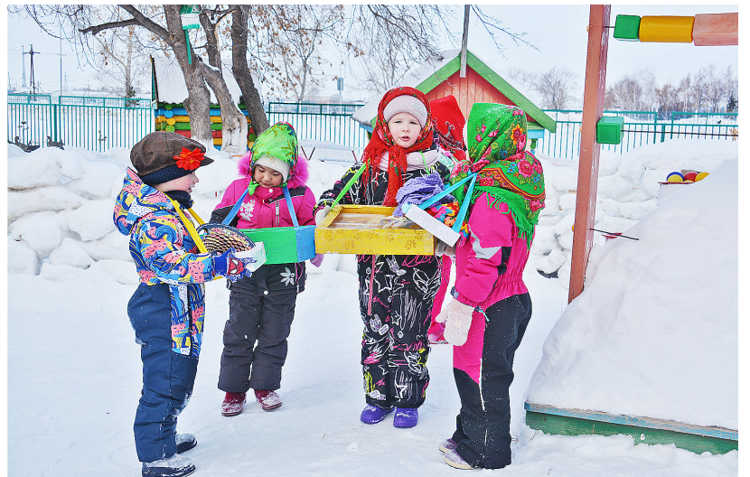
Участники весёлой ярмарки