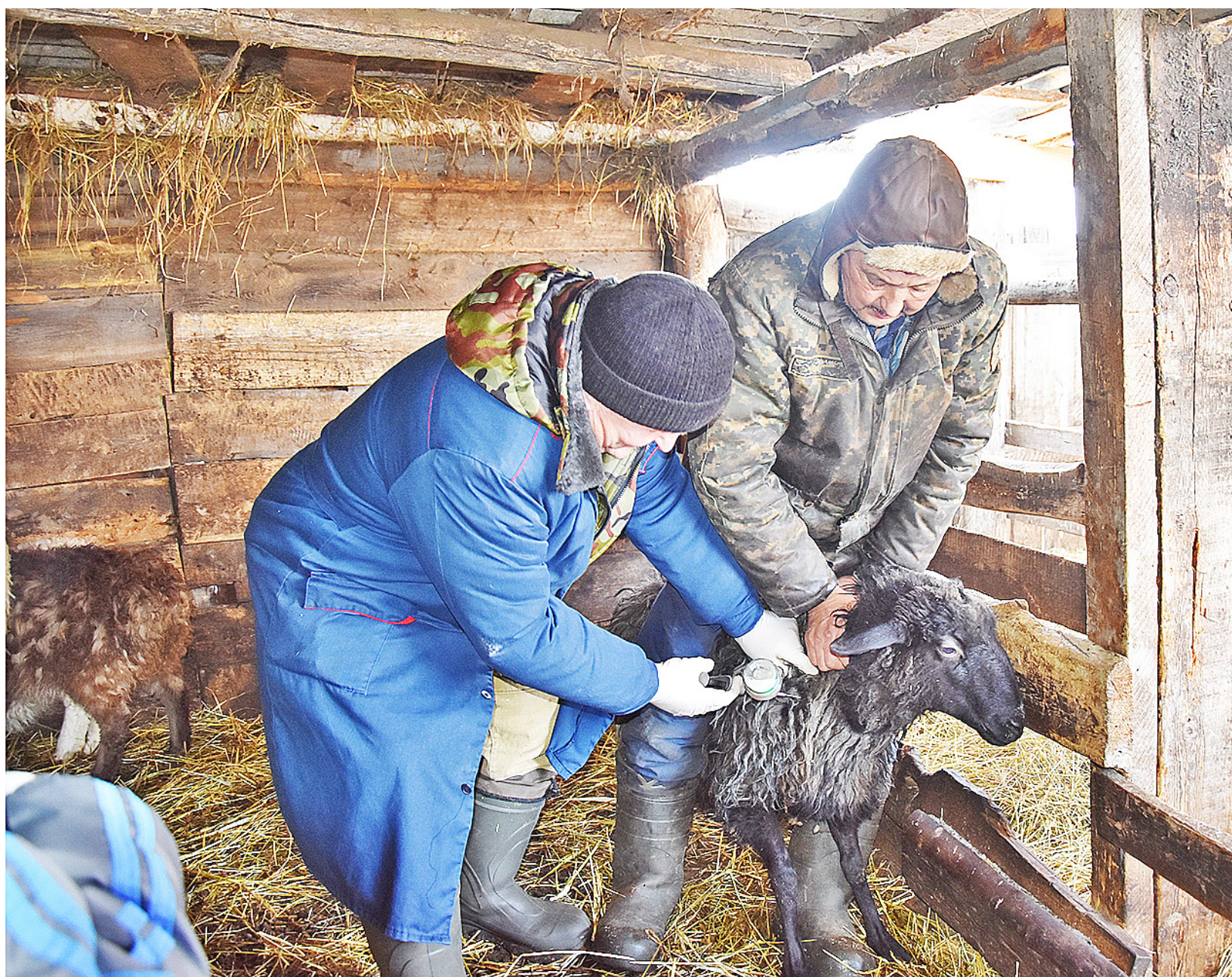
Единственной мерой профилактики ящура является вакцинация

Из-за вспышки ящура на территории Республики Казахстан и в связи с угрозой возникновения этого серьёзного заболевания в Тюменской области в районе началась вакцинация крупного и малого рогатого скота.