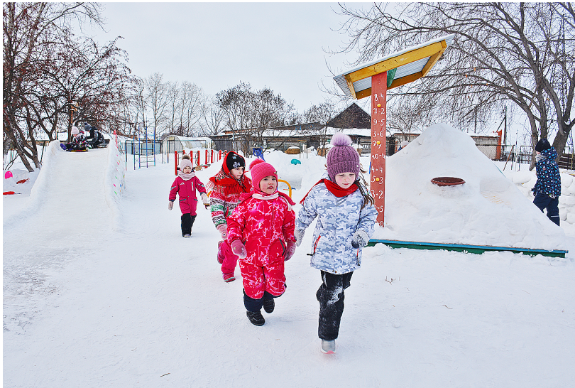
Для игр на улице малышам созданы хорошие условия