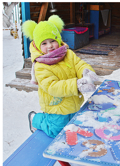
Прогулка на свежем воздухе для ребёнка – радость

русского быта: кровать, застеленная вышитым пледом, люлька для малышек и настоящая русская печь, в которую ставятся длинным ухватом, изготовленным в кузнице, глиняные горшки и чугуны со щами и кашей. Детям рассказали, что в русской деревенской избе жили бедно. Еда при этом была простой, но очень вкусной. В музее есть и ковры, и рушники, умело вышитые бабушками и прабабушками.