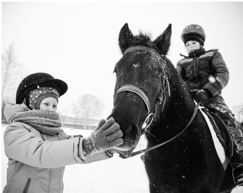
У детей и Куки любовь взаимна.

— Во время первой экскурсии показываем быт конюшни и обяза-