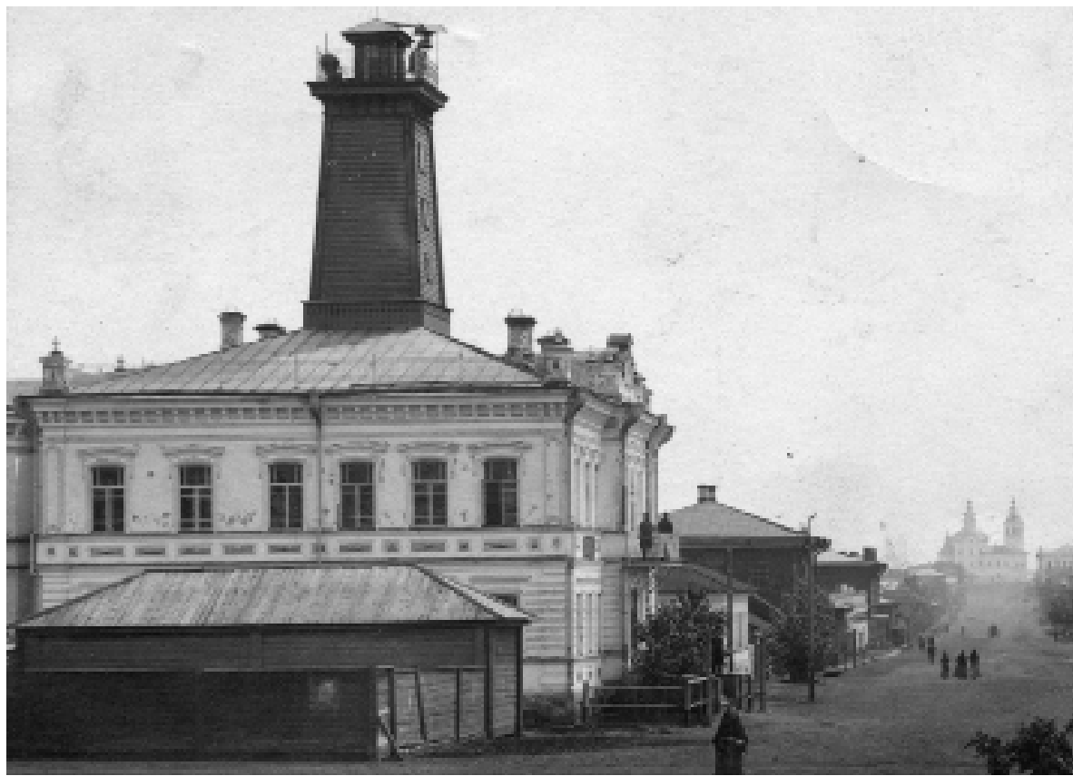
Здание общественного городского управления (городская управа) с пожарной каланчой, на переднем плане – часть строений «пожарного обоза». 1907 год.

багров и щитов – по 10. Три лестницы длиной до 9 аршин. Пил – 4, топоров – 10, лопат железных и деревянных – по 5. Два фонаря и два шара на каланчу, приобретённые в 1863 г. Также имелся колокол «достаточной величины и довольно звучный». К рекам Ишим и Карасуль было устроено 5 спусков, и ещё один спуск планировалось обустроить за счёт городских средств, чтобы в городе не осталось бы ни одного района, от которого вода бы находилась далее 300 сажень.