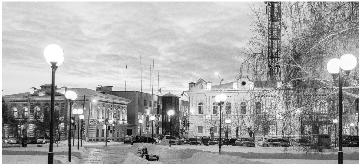
С каждым днём хорошеет Ишим. В новом году преобразования продолжатся.