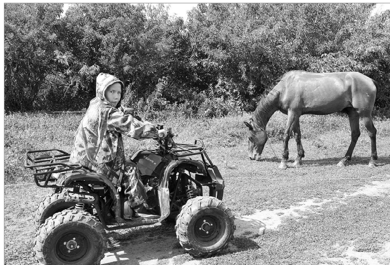
И с «железным конем» на ты...