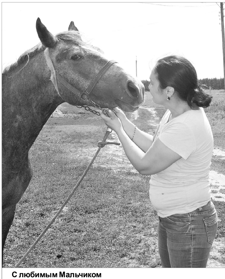
С любимым Мальчиком