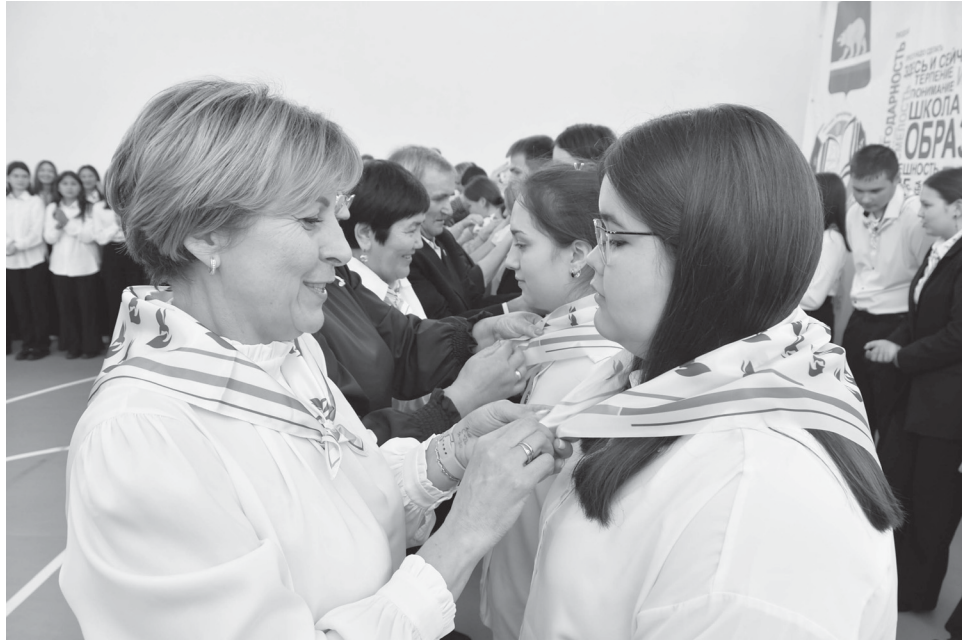
Ребятам повязали символы педкласса – галстуки

В торжественной обстановке прошла церемония посвящения учащихся в психолого-педагогический класс. На IX Слёте в ряды психолого-педагогических классов приняли 53 новобранца, которые сделали выбор в пользу педагогической профессии. Учащиеся получили атрибуты ППК, приняли присягу, исполнили гимн педклассов и по-