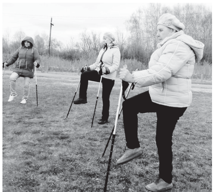
По материалам сайта областной больницы № 24

Можно выполнять аэробные упражнения продолжительностью по десять минут в день. Это может быть простая утренняя зарядка, упражнения на равновесие три раза в неделю. Необходимо много двигаться: гулять на свежем воздухе, заниматься скандинавской ходьбой, и лучше делать всё это в компании единомышленников».