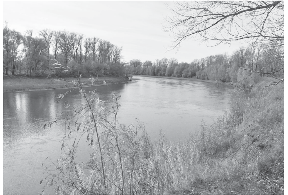
Река Тобол |

Ещё Тобол является рекой с достаточно интенсивным течением. И мостовое сооружение должно предполагать какие-то арки для прохода воды. Иначе его снёс бы первый же ледоход,