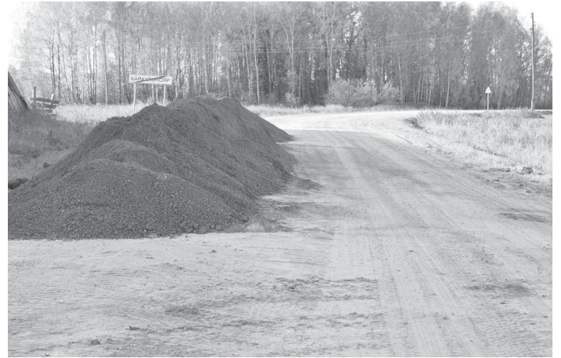
Ремонт улицы Полевой |

- Как обычно, летние хлопоты начались с пожароопас-