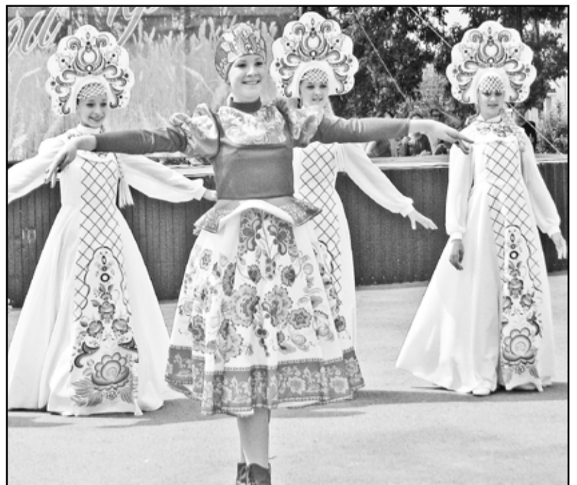
Участницы детского танцевального коллектива «Стрекоза»