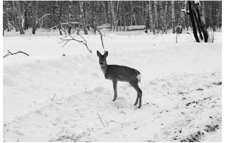
Молодая косуля вышла к людям в поисках корма

Омутинского районного отдела Госохотдепартамента Тюменской области, в нашем муниципалитете такие случаи фиксируются и пресекаются на месте. Например, не так давно охотинспекторами на дороге с. Большой Краснояр - д. Томская были задержаны лица, незаконно отстрелявшие четыре особи косули. По данному инциденту проводятся следственные мероприятия, виновные, в соответствии с действующим законодательством, будут наказаны.