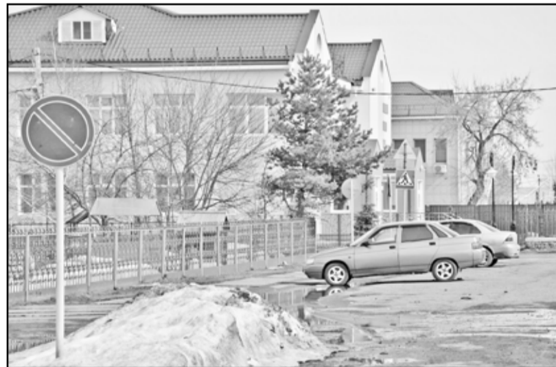
Для хозяев этих машин запрещающий знак ничего не значит

Наши автомобилисты – народ отчаянный и бесшабашный отчасти. Им дорожные знаки – до лампочки. Хоть синим огнём они гори.