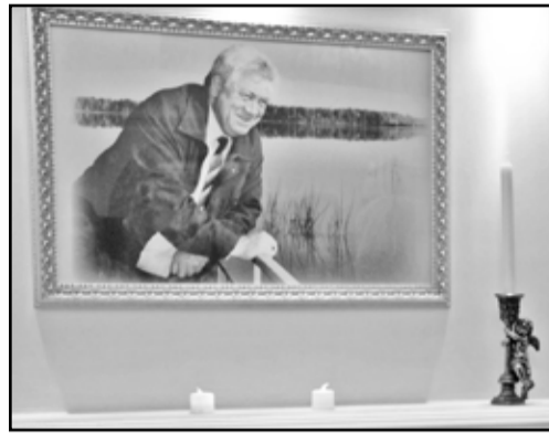
Валерий Николаевич всегда был открыт душой и сердцем

Эти руководители не испугались дополнительных забот во времена и без того хлопотных для них, ибо понимали, что решают общую всенародную задачу. Увы, сегодня лич-