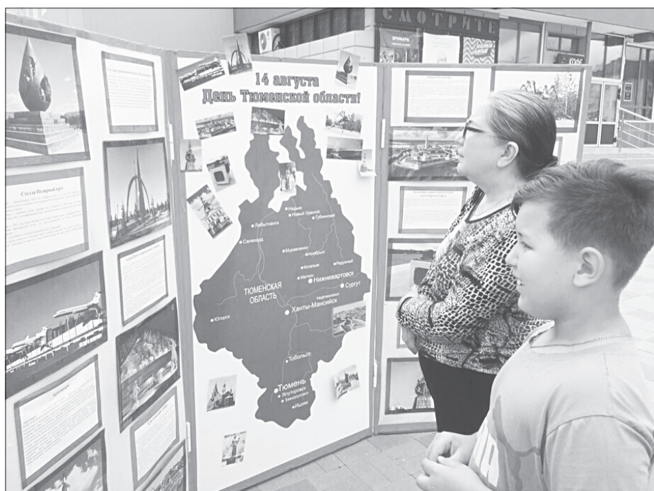
Активисты молодёжки тоже провели акцию, посвящённую Дню рождения области. Они предложили ялуторовчанам узнать достопримечательности разных городов региона и расположить их изображения на карте

■ Ялуторовск вошёл в состав Тюменской области в 1944 году, а в 1963-м стал городом областного подчинения