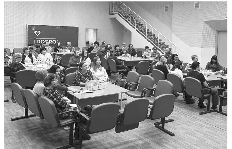
Момент обучения общественных наблюдателей к выборам президента РФ в Голышмановском молодёжном центре

Влад УДИЛОВ Фото пресс-службы Общественной палаты Тюменской области