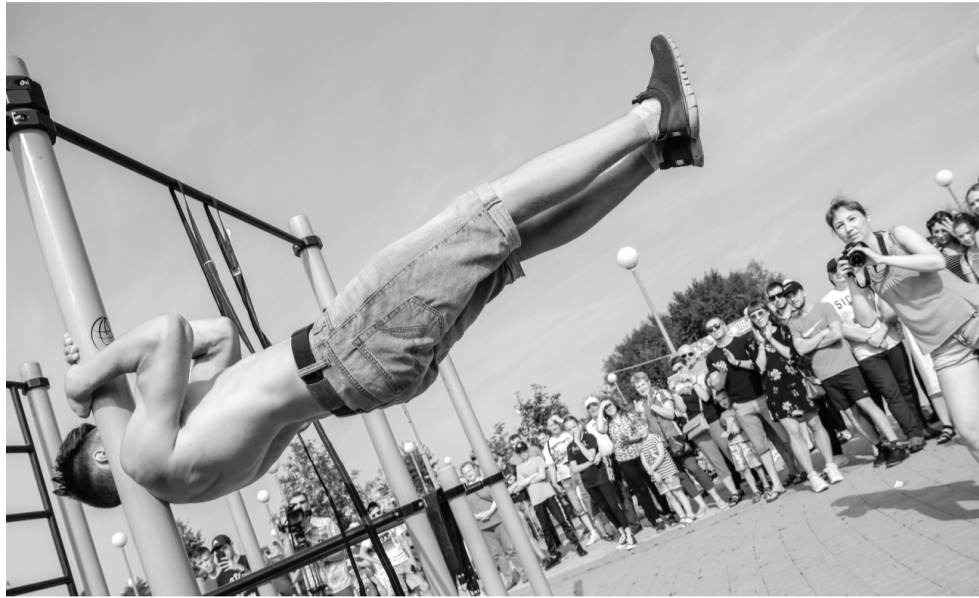
Основной акцент в воркауте делается на работу с собственным весом и развитие силы и выносливости.

Профориентационный проект «Стальная гвардия» – проведение танкового турнира. Он заинтересовывал