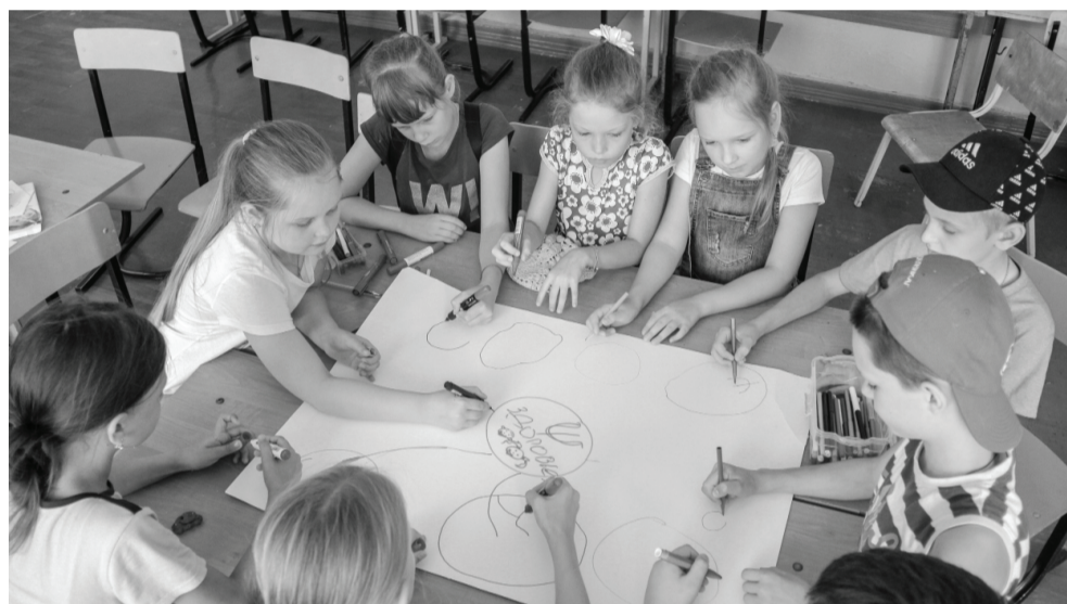
Тандем детей и педагогов-психологов получился результативным. Это – понимание ценностного отношения к своему физическому и психологическому здоровью.

На стадионе под шедрым августовским солнышком Ирина Поливаева в рамках программы «Моё физическое