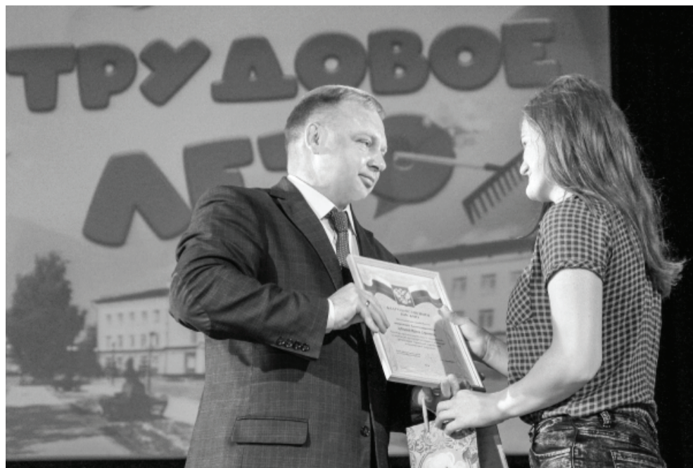
Лучшие бойцы трудовых подростковых отрядов получили награды.

Для кого-то лето было беззаботным, познавательным, развлекательным, а для кого-то и трудовым.