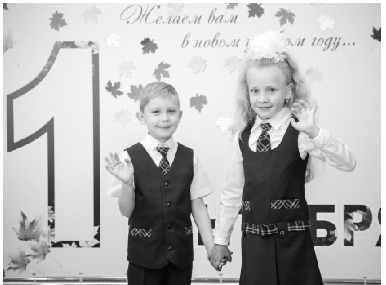
Приближается один из самых значимых дней в году – праздник, с которого начиналась и начинается для каждого следующего поколения дорога в мир знаний! Поздравляем вас с началом нового учебного года!!!