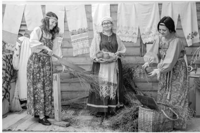
Музейный комплекс им. П.П. Ершова презентует интерактивный проект «Сибирский лён».

сию по желанию, получила специализацию «иностранный язык». Со своими перво-клашками познакомилась на этапе их подготовки к школе.