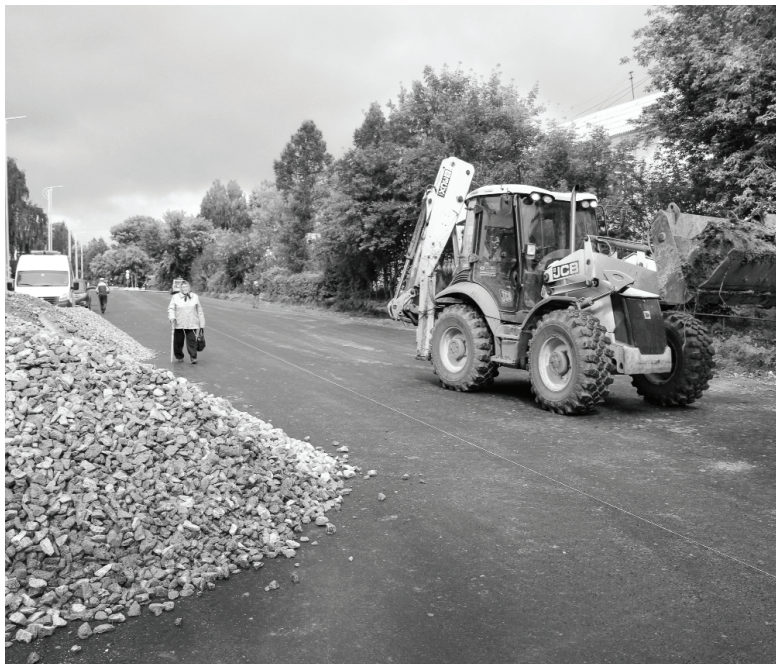
На середину августа процент выполнения работ по ремонту автомобильных дорог – 65, пешеходных тротуаров – 80.