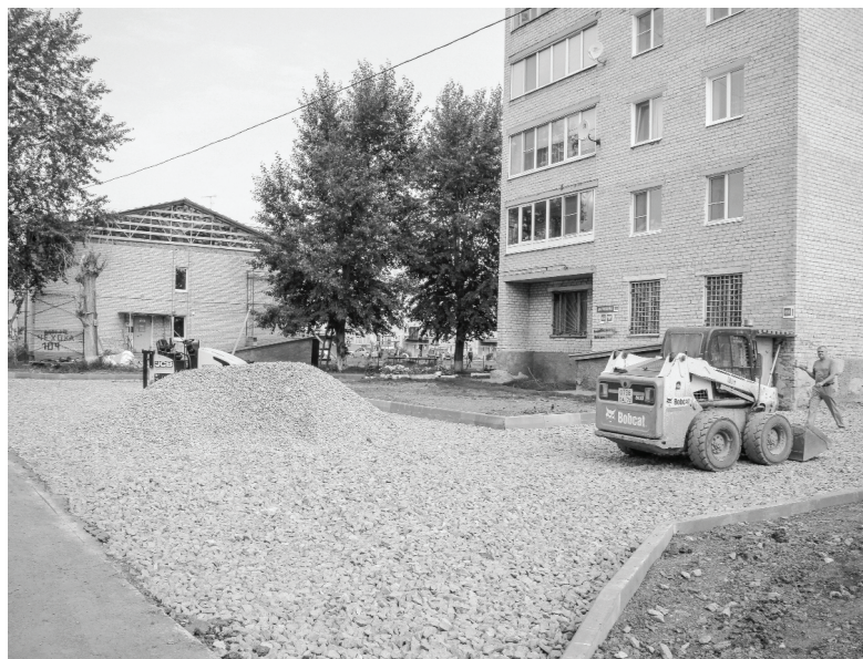
На 2020 год запланирован ремонт 11 дворов.

На ремонте дворовых территорий в Ишиме также работают ИП Емельянов и МУП «Спецавтохозяйство». При необходимости предварительно проводится замена сетей водоснабжения и водоотведения.