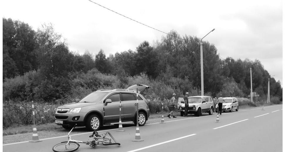
Беспечность едва не привела к страшной трагедии

Сделайте прогулку вашего ребёнка на велосипеде безопасной!