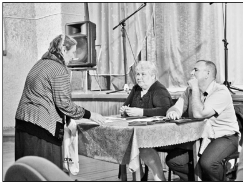
Дубынские жители донесли до властей свои проблемы и чаяния

В ряду вопросов, которые нарочито громко поднимали перед сво-