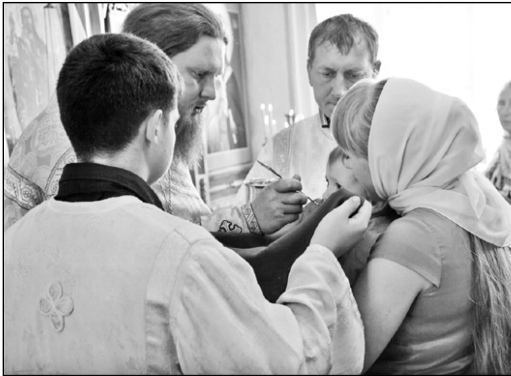
В таинстве причастия происходит вполне материальное соединение человека со Христом

Великий двенадцатый праздник – Преображение Господа Бога и Спаса нашего Ии-