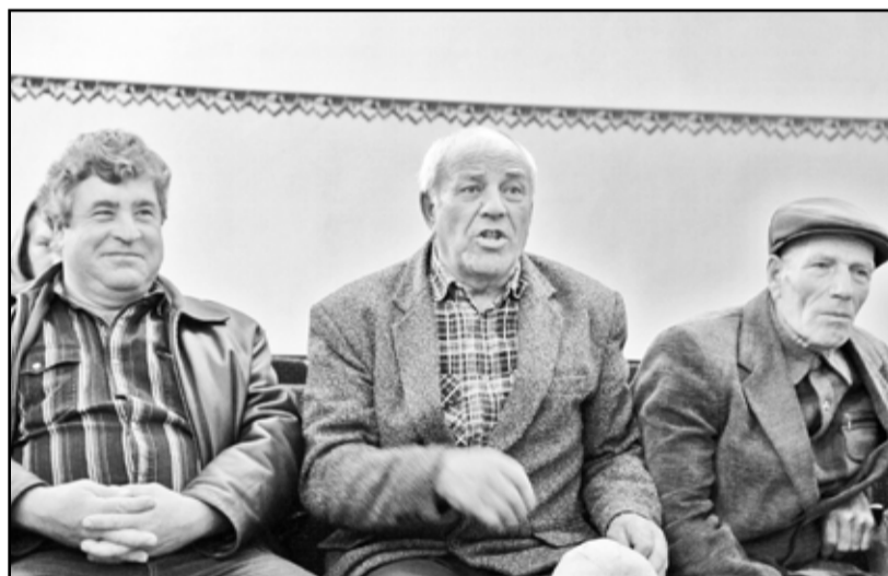
Встреча в Новоалександровке прошла в активном режиме. Выступить смогли все желающие

Если серьёзно, то, кроме бурьяна, который не скашивают либо по причине бессилия и немощи престарелых хозяев заросших домовладений и отсутствия совести у их живущих неподалёку детей, либо потому, что сельские жители не умеют теперь косить траву литовской, дубынцев, грачёвцев и новоалександровцев волнует и кое-что более, прямо скажем, страшное. Это их вековая и надоевшая в своей обыденности проблема –