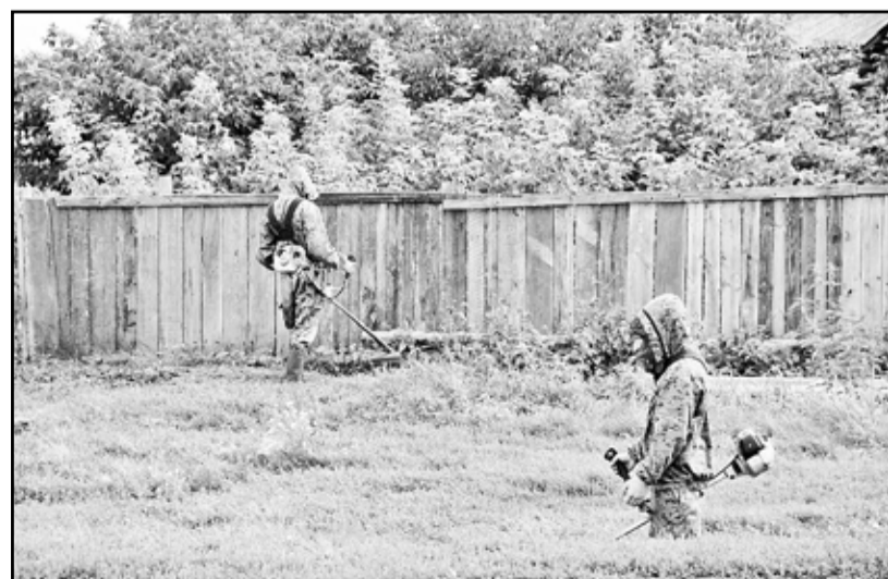
Работа по благоустройству ведётся практически ежедневно