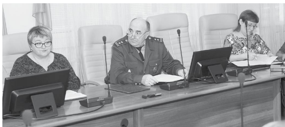
* Реализация национальных проектов касается каждого из нас. Об этом говорилось на заседании.

— Самая неблагополучная территория в плане этого заболевания — Менжинская. Поселение большое, в