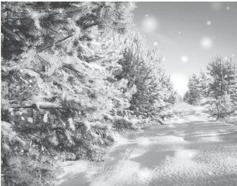
* «Мороз снежком укутывал...»