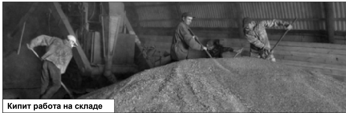
Кипит работа на складе