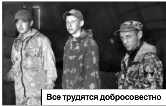
Все трудятся добросовестно