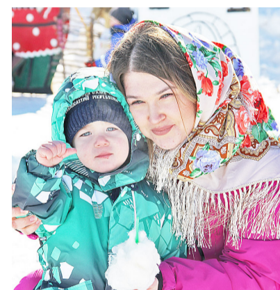
Улыбки гостей – благодарность организаторам за хороший праздник

перенести канистру с жидкостью и перебраться через барьер из тюков сена. Все проявили стойкость, силу воли, командный дух и стремление к победе, присущие настоящим сибирякам. Несмотря на трудности, участники успешно добрались до финиша, получили незабываемые впечатления и испытали массу положительных эмоций.