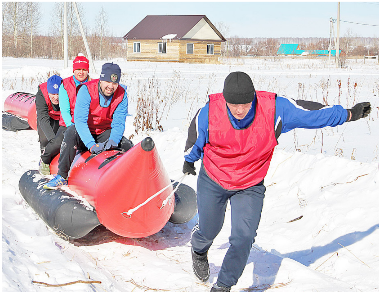
Команда Большеярковского сельского поселения вот уже второй год занимает первое место в спортивном забеге

биринт, транспортировать колёса в заданное место, прокатиться на банане (на банан садятся два участника, остальные их катят), преодолеть снежную насыпь, пройти тоннель,