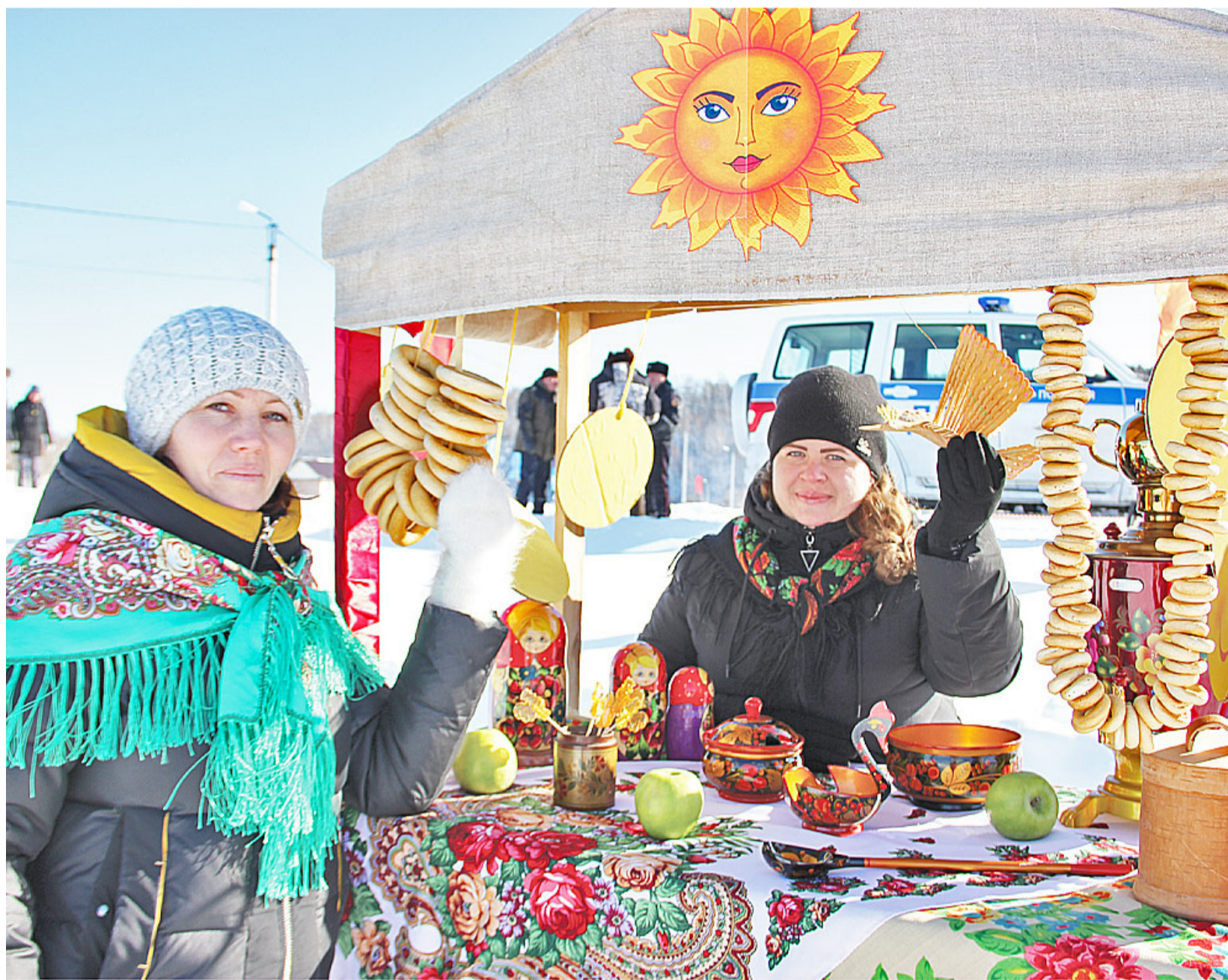
В этот день в Боровлянке царил атмосфера добра и радости. Масленичные гулянья завершились Прощёным воскресеньем, когда люди просят прощения у близких и сами прощают тех, кто раскаивается, чтобы с чистыми помыслами встретить Великий пост

В субботу, 13 марта, в деревне Боровлянке весело проводили зиму