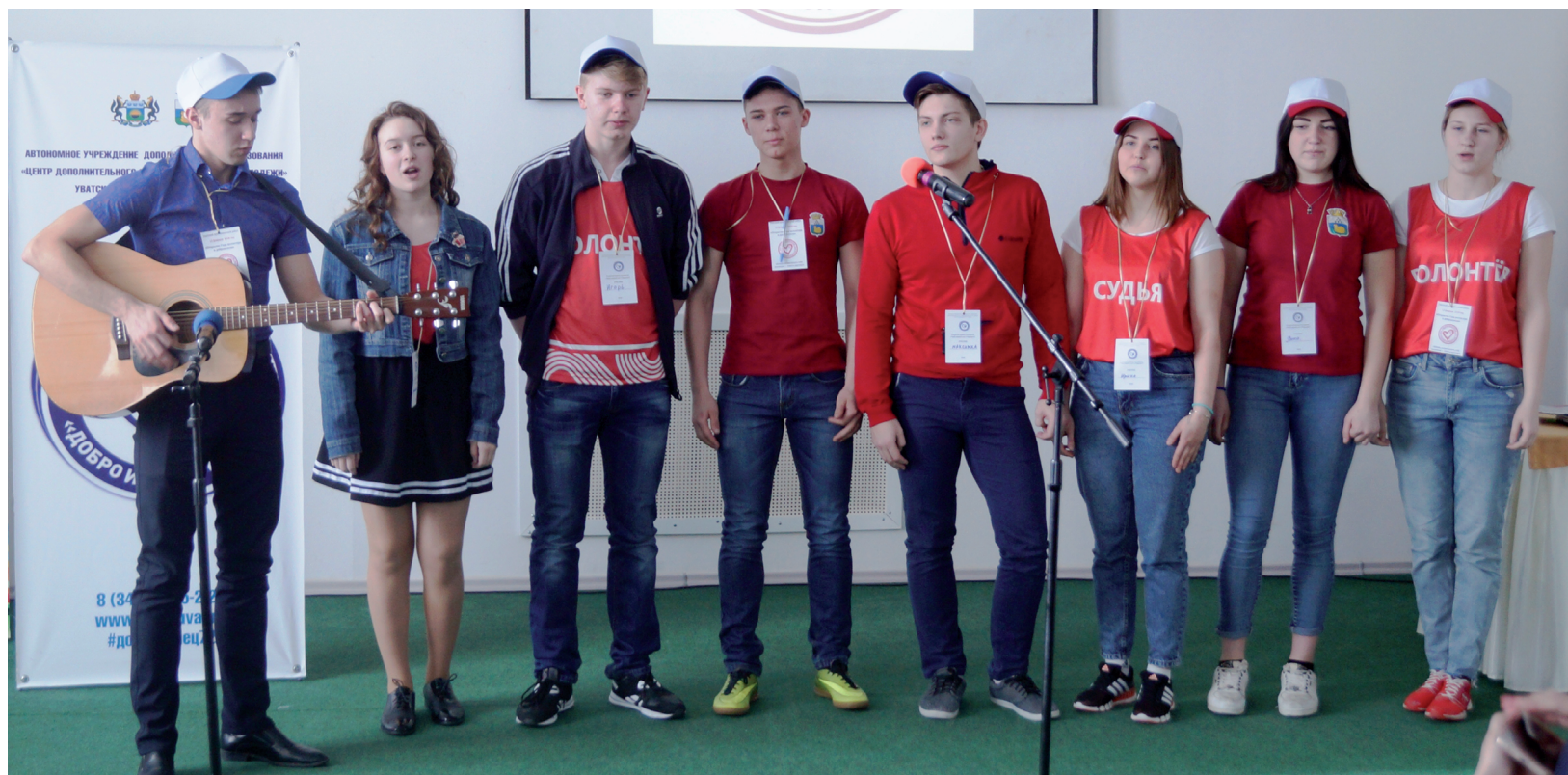
С песней по жизни шагать веселей.