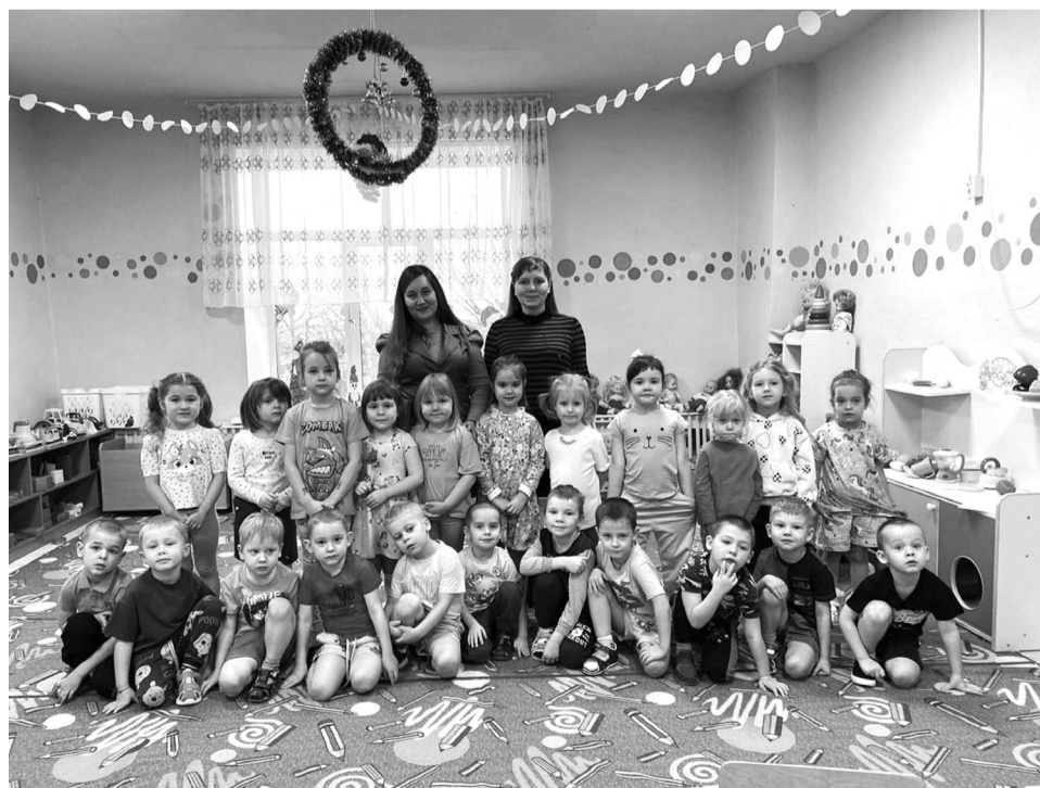
Финальным этапом любой встречи является фото на память

Родители юных радиоспикеров с нетерпением ждут выступления своих детей в эфире «Радио Сорокино» в новогоднем радиовыпуске. Произойдёт это 31 декабря в 19:40 на волнах Радио 7.