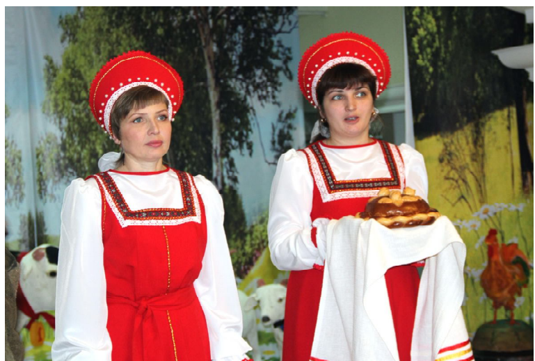
Делегации сельских поселений встречали хлебом-солью