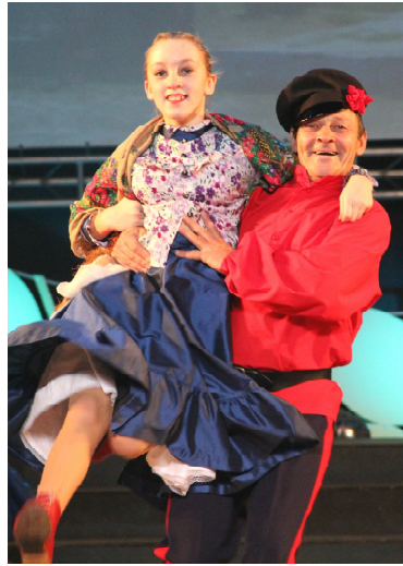
Танец в подарок

Уважаемые владельцы крупных и малых форм хозяйствования!