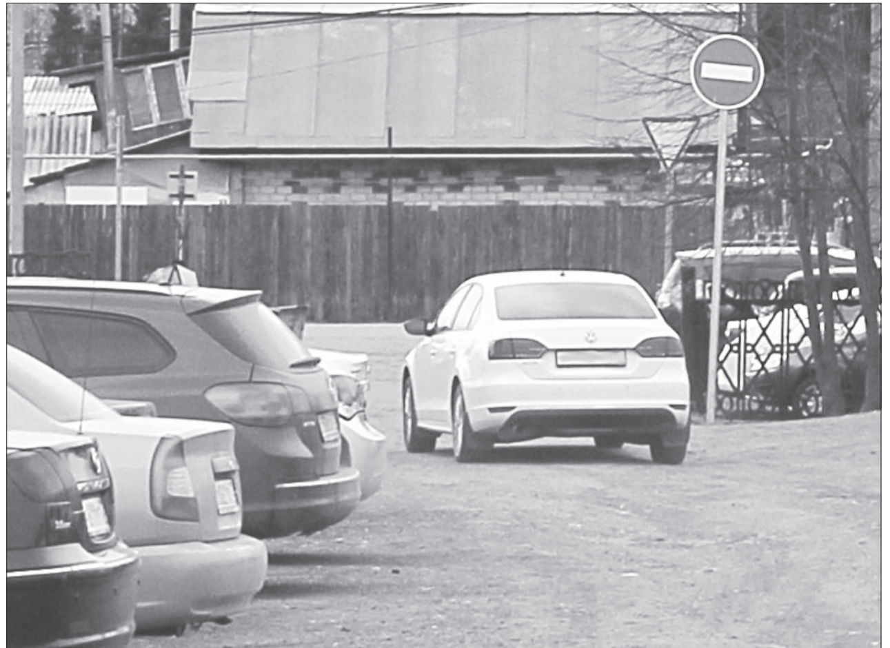
Большинство автомобилистов, посещающих поликлинику, не обращают внимания на запрещающий знак