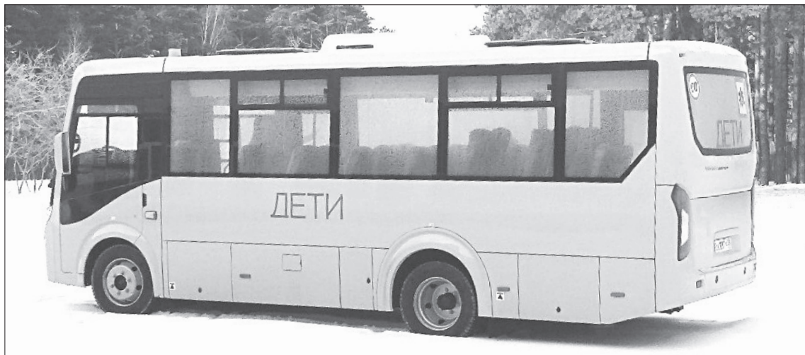
Памятинские школьники уже планируют поездки на новом автобусе

Автобусами обеспечены все учебные учреждения муниципалитета. Новый транспорт марок КАВЗ и ПАЗ поступил в распоряжение школ Ивановки, Старого Кавдыка, Зиново, Асланы и Памятного. Автобусы рассчитаны на 26, 28 и 34 пассажирских места. Самые вместительные закуплены для ребяташек из Зиново и Асланы, поскольку эти учебные заведения имеют большое количество учеников, - пояснили в районном отделе образования.