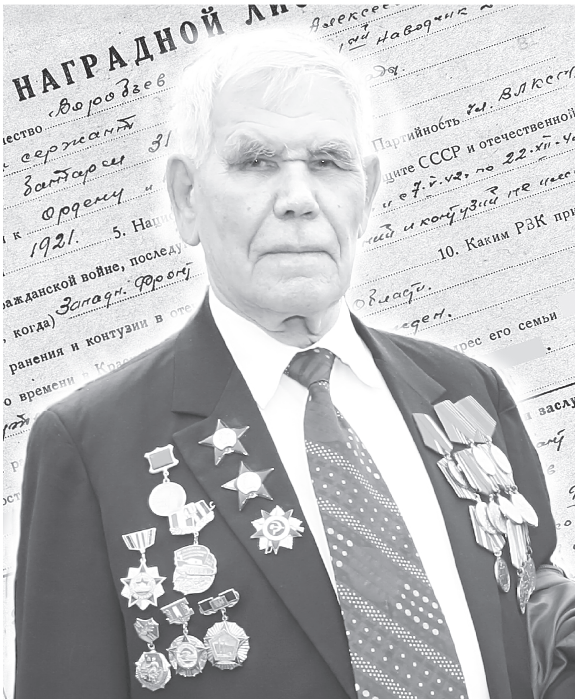
О минувшей войне напоминают награды на парадном пиджаке

В ожидании атаки. Заглянем в журнал боевых действий 31-й танковой бригады за 5 декабря 1941 года. Красивым почерком