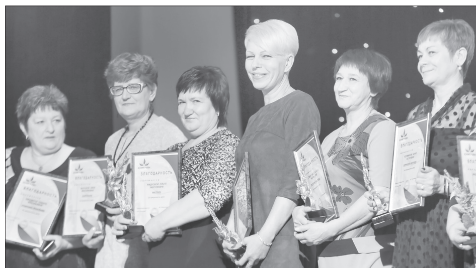
Золотой фонд предприятия - мастера

Значение «Юнигрэйна» для Ялуторовска трудно переоценить. Предприятие - один из крупнейших работодателей в городе и вносит значительный вклад в его экономическое развитие. На достигнутых успехах здесь останавливаться не собираются. В официальных поздравлениях и кулуарах не раз звучала мысль: десять лет - это много или мало для нашего стремительного времени? Сошлись на том, что это лишь начало пути. Испокон веков история предприятия и города тесно связаны между собой. И то, что на бывшем комбинате хлебопродуктов наблюдаются перемены к лучшему, радует каждого горожанина. Позитивный настрой выражен и в гимне предприятия: «Расти и крепни, славный «Юнигрэйн!».