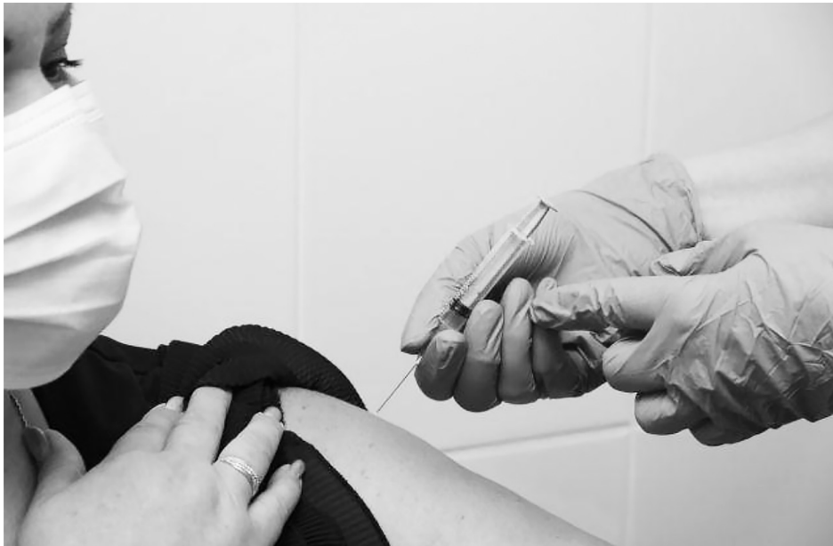
Первые добровольцы Тюменского региона получили вакцину «ЭпиВакКорона», в результате чего должен выработаться иммунитет минимум на полгода.

Добровольцы рассказали, что с ними заключён договор, в котором прописаны ограничения, в том числе на употребление алкоголя, посещение общественных мест, оговорено обязательное ношение