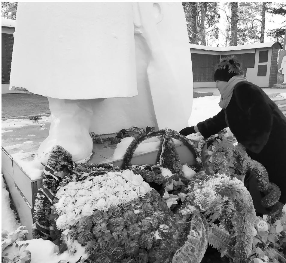
Нижнетавдинцы возлагают цветы к памятнику коленопреклонённого воина.