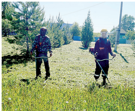
Приводим в порядок Молодёжную аллею

– В благоустройстве значительная часть бюджета у нас уходит на уличное освещение – электроэнергия, техобслуживание, закуп ламп и прочего сопутствующего оборудования. В прошлом году мы произвели замену светильников на светодиодные по улице Ленина и полностью заменили уличное освещение на энергосберегающие осветительные приборы в Алге и Иреке. В перспективе запланированы такие же работы в Куприной.