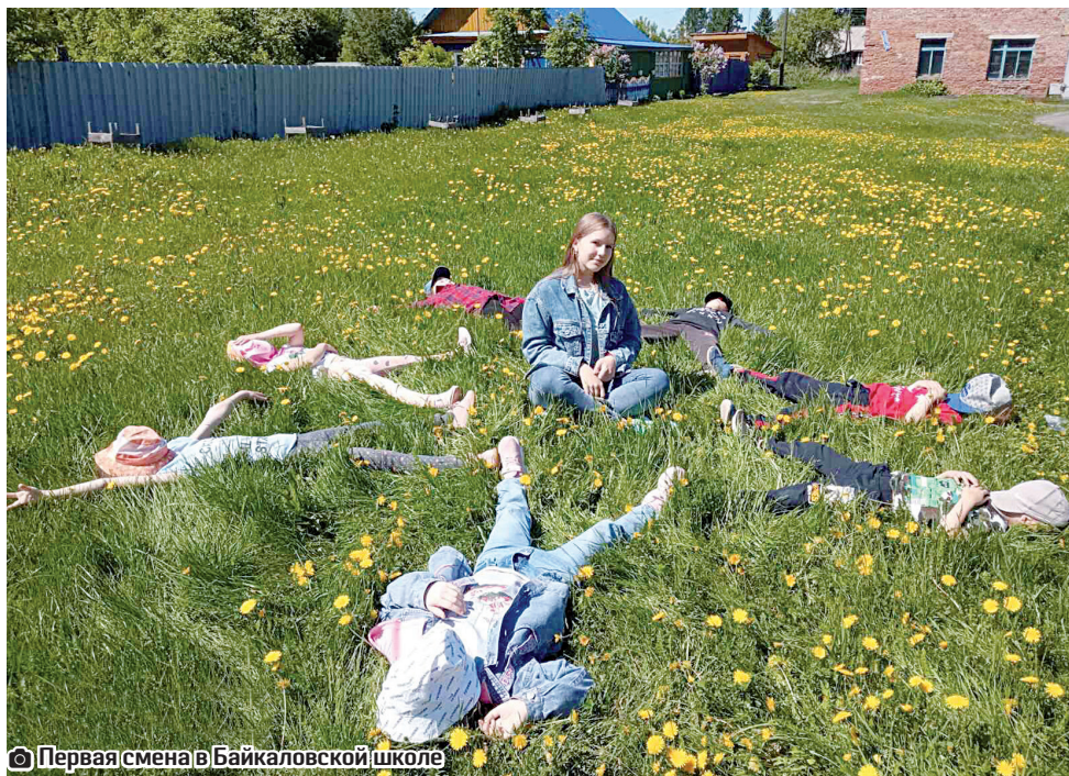
Первая смена в Байкаловской школе

Распахнули двери перед непоседливой детворой 11 пришкольных лагерей. Во вторую смену запланирована работа пяти, и в третью смену примут детишек в 7 лагерях. Организаторами летнего отдыха разработано восемь программ работы, все они были направлены на соответствующую экспертизу специалистам Тюменского областного государственного института региональ-