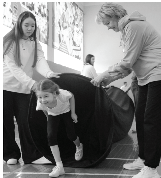
Участники спортивной встречи замечательно провели время.