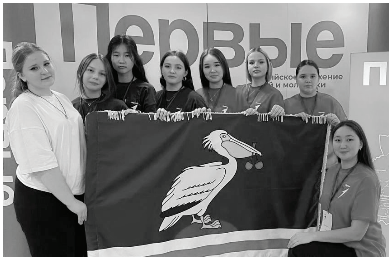
Юные лидеры движения за время слёта узнали много интересного, познакомились с новыми людьми и зарядились положительной энергией.

На базе детского оздоровительного центра «Ребятчья республика» состоялась встреча лидеров Движения Первых Тюменской области.