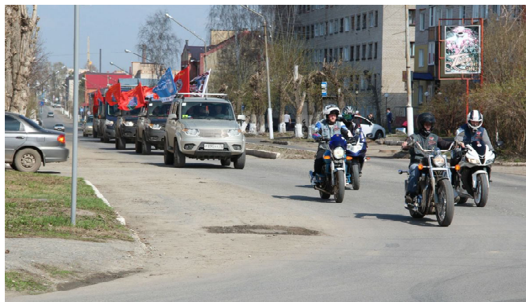
Колонна автомобилей Дальневосточного луча прибыла в г.Ишим