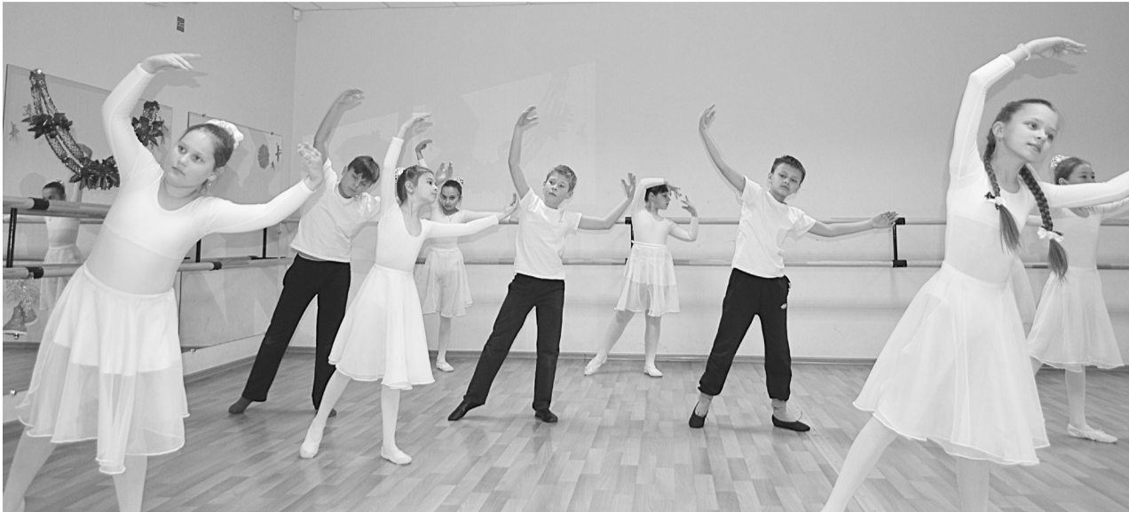
Глядя на старания ребят, невольно убеждаешься, что хореография – трудоёмкое искусство.