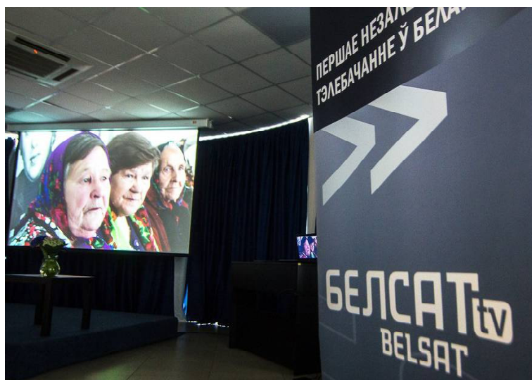
➤ Презентация фильма «Самоходы» в Минске 1 июня 2017 г.

В фильме «Самоходы» звучали белорусские песни, сохранившиеся от переселенцев. Эти песни четверть века назад подхватил сельский фольклорный ансамбль «Россияночка», в составе которого и сейчас потомки самоходцев, уже в четвёртом поколении. А ещё в фильме показано, как варится знаменитое самоходское пиво, рецепт которого был принесён из Беларуси в Сибирь больше ста лет назад и сохранившийся там до сей поры. Мелькали кадры знакомых ермаковских улиц, деревенского погоста и родной моей Салыповки — нижней части Ермаков, где когда-то жила семья моих дедов Новиковых.