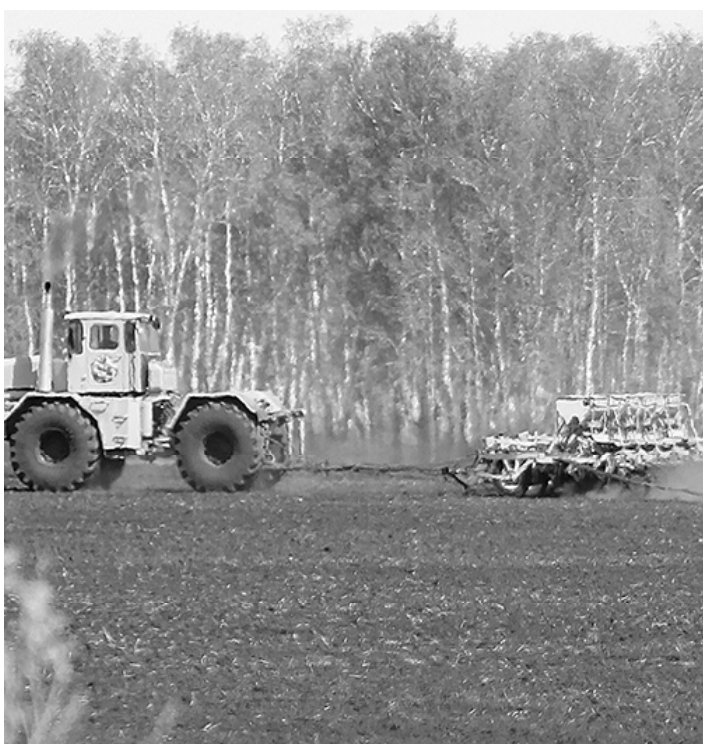
* Посевная финишировала