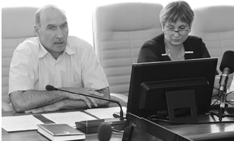
* Во время заседания

— Процесс введения федеральных государственных образовательных стандартов в нашем районе ведёт свой отсчёт с 2010 года. Тогда к реализации ФГОС начального общего образования приступила Маслянская школа. В 2011-ом стандартами стали охвачены все наши школы на ступени начального образования. Параллельно в Новоандреевке апробировалась модель организации внеурочной деятельности в основной школе. 2014-2015 учебный год стал переходным периодом введения ФГОС, они распространились и на дошколь-