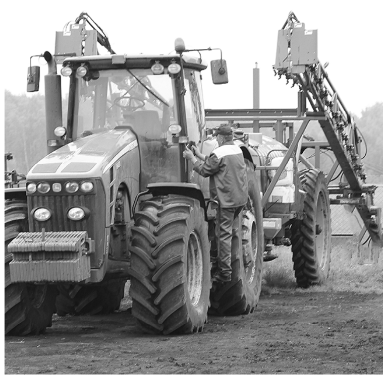
* Химвпрополка в разгаре