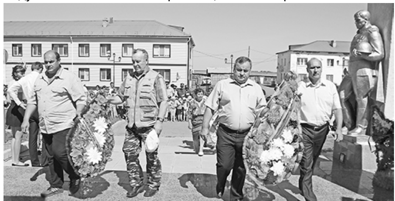
* Чтим память павших