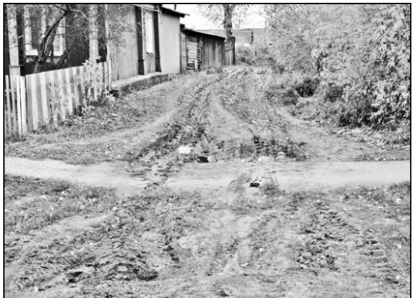
В непогоду по таким проулочкам можно проехать только на тракторе. Что и делается

Есть такие в нашем селе. Но не об этом пойдёт речь. Улица Ленина – магистральная в селе Казанском. Она широка и величава как река Волга. Но и у Волги существуют притоки, заросшие камышом и не столь величавые, как легендарная река, ими питающаяся.