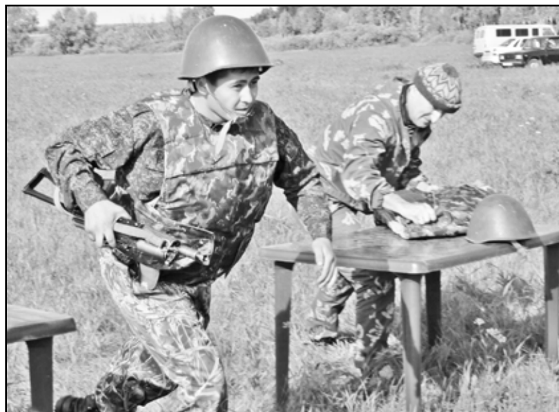
Бежать в полной боевой экипировке с автоматом в руках – задача не из лёгких