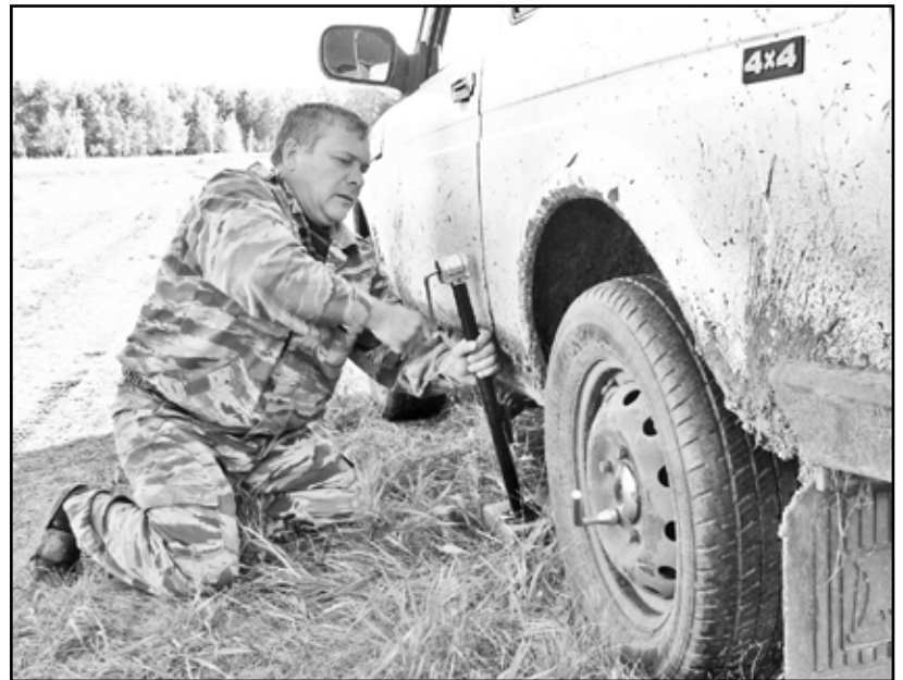
Разбортовать колесо на время – один из этапов соревнований

ных чад. Не станешь же среди ночи бухать из дробовика.