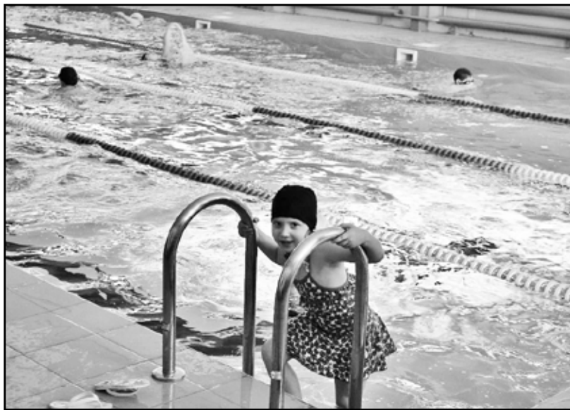
Вот уже второй год в нашем селе работает бассейн, и теперь не нужно вести детей за 60 километров в Ишим для занятий плаванием