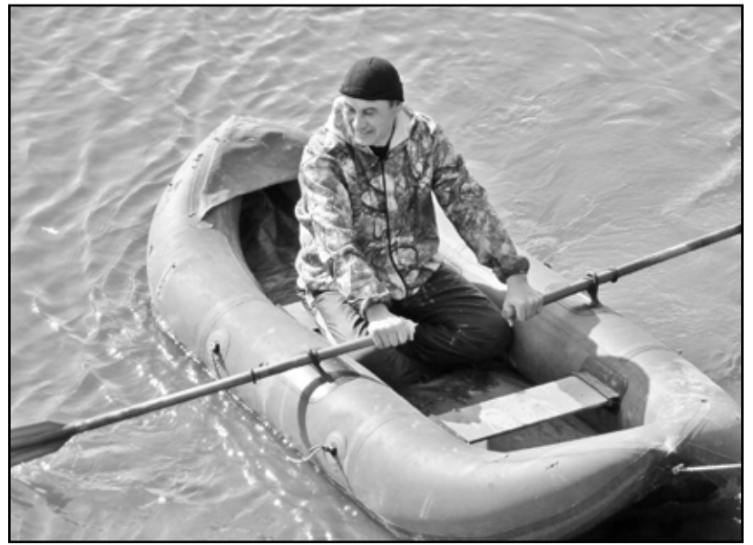
Полицейский должен уметь всё: и стрелять, и лодкой управлять