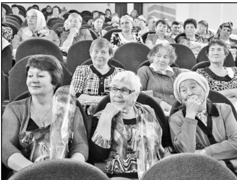
Цветы плюс внимание, и для женщины будни становятся праздником