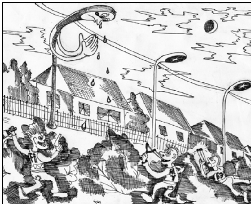
Пощадите ради бога!

ных улиц отпускается от сих и до сих. Меньше потратить можно, а больше – ни-ни. За финансовое нарушение голову главе открутят, как лампочку, – мигом. Вот и призывает