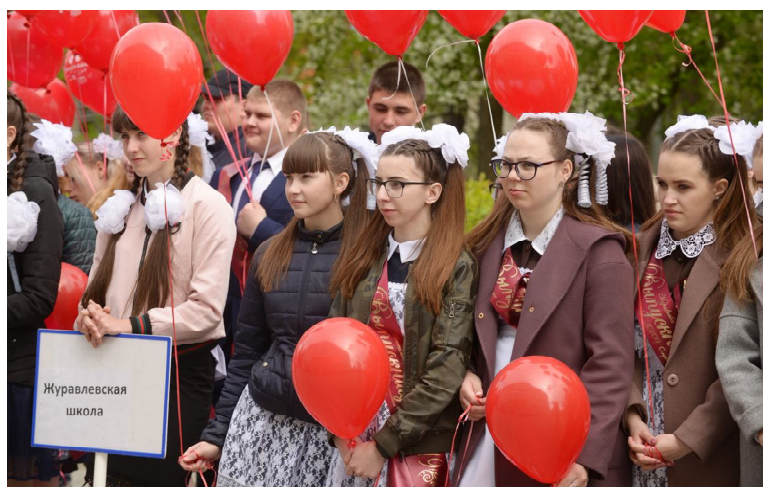
Немного грустно на торжественной линейке