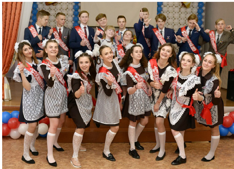
Выпускники СОШ №1 выступают перед родителями и учителями