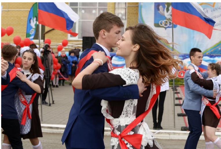
Прощальный школьный вальс запомнится надолго

21 мая последний звонок прозвучал для одиннадцатиклассников, а также для учеников 9-х классов. Для них он был особенным и ознаменовал рубеж между детской и взрослой жизнью. Скоро выпускники попрощаются с любимыми учителями, одноклассниками и вступят в не менее интересную студенческую пору.