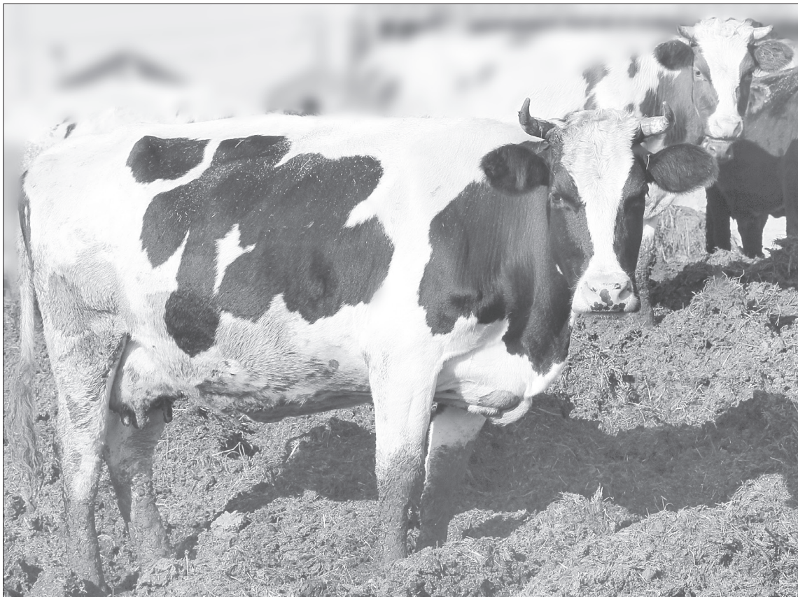
На первых стадиях заболевания лейкоз у коров можно выявить только по анализу крови

Меры предосторожности. Как пояснила главный гос-