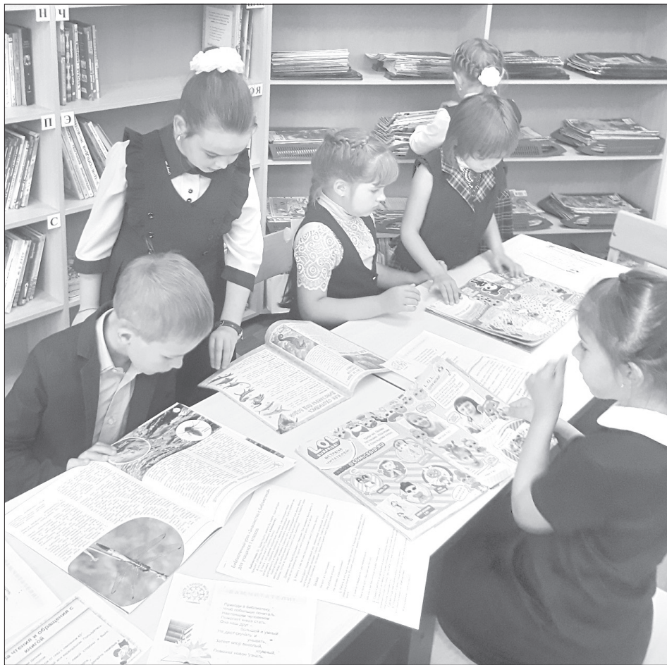
Для карабашских первоклассников этот поход в библиотеку стал дебютным

Есть на свете такой дом, в котором собраны все путеводители по жизни. Называется он библиотека. Тринадцать перво-классников из Карабаша познакомились с одной из них в школе. Ребята узнали, что книги быва-ют разные: большие и ма-