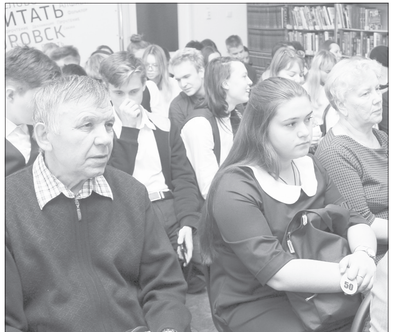
Пообщаться с литераторами пришли школьники, педагоги и местные поэты

жанров издаётся сегодня множество. В Экспертный совет премии за год поступает до 400 рукописей. А вот качество изданий явно хромает. Причин несколько. Во-первых, почти исчезла квалифицированная критика (не путать с советской цензурой), не так уж много настоящих редакторов, которые могут подставить плечо автору, подсказать, что-то исправить. На рынке российской словесности явный дефицит толковых обозревателей, которые могли бы познакомить читателей с книжными новинками. Вот и получается, что в массе своей среднестатистический россиянин не в состоянии сформировать личный круг чтения. Мало кто знает, увы, и о самой премии, и о победителях (посмотрите список финалистов и сделайте собственные выводы). Во-вторых, современ-