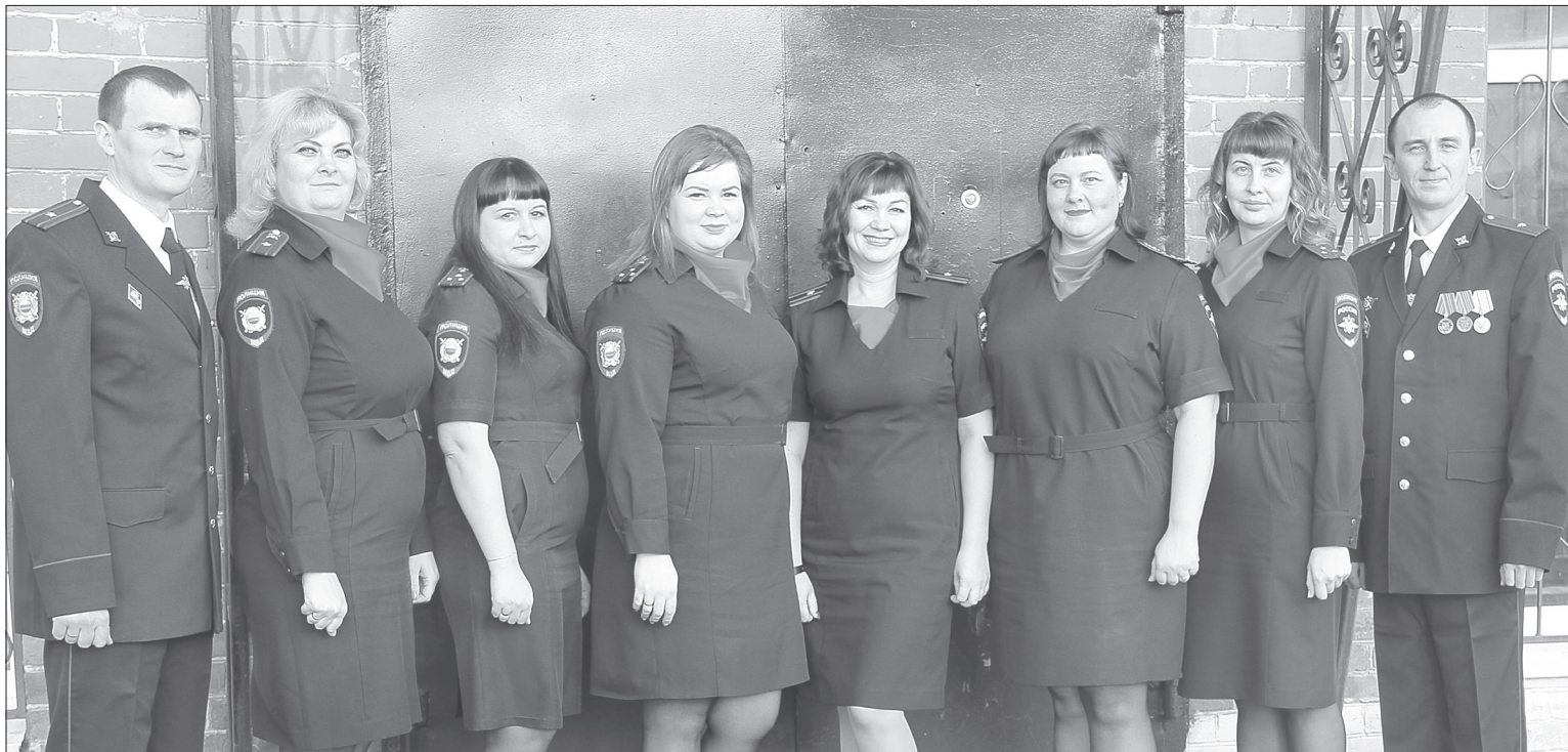
За годы работы в отделении дознания сформировался сплоченный и профессиональный коллектив из восьми человек