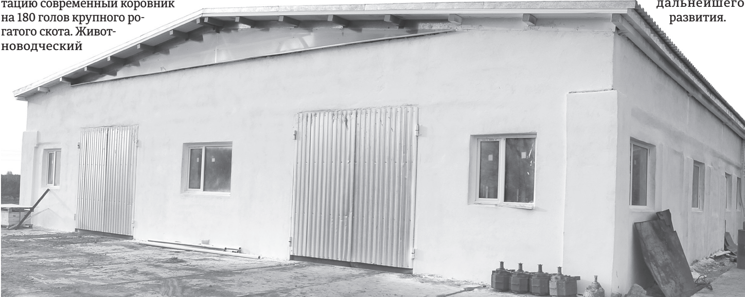
Новый коровник рассчитан на 180 голов. При его возведении строители применили новые технологии – каркасную кровлю, световые «коньки», шнековую систему навозоудаления

Цена на молочном рынке стабильно держится на достаточно высоком уровне. Расширение дойного стада – выгодное вложение капитала и гарантированное получение инвестиций для дальнейшего развития.