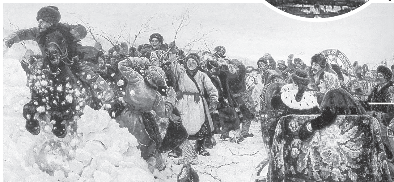
Фрагмент картины Василия Сурикова «Взятие снежного городка»