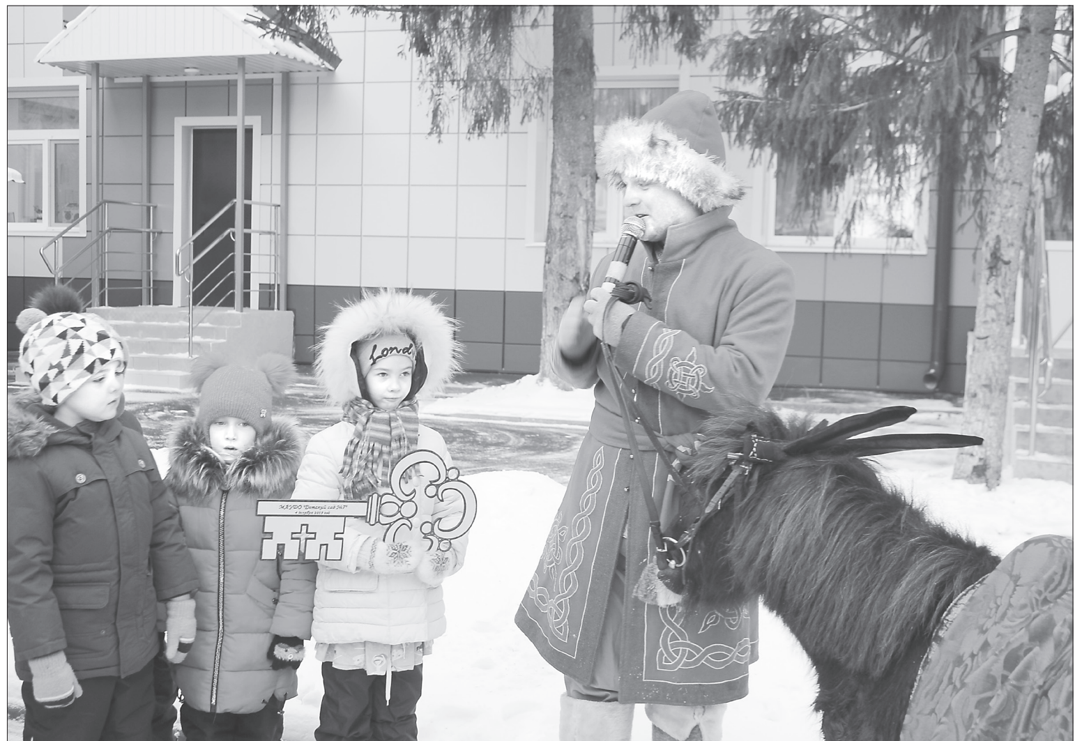
Символический ключ от обновлённого учреждения передали малышам Конёк-Горбунок и Иван - герои всеми любимой сказки

В новом дошкольном учреждении идёт набор воспитанников 2014 и 2015 годов рождения