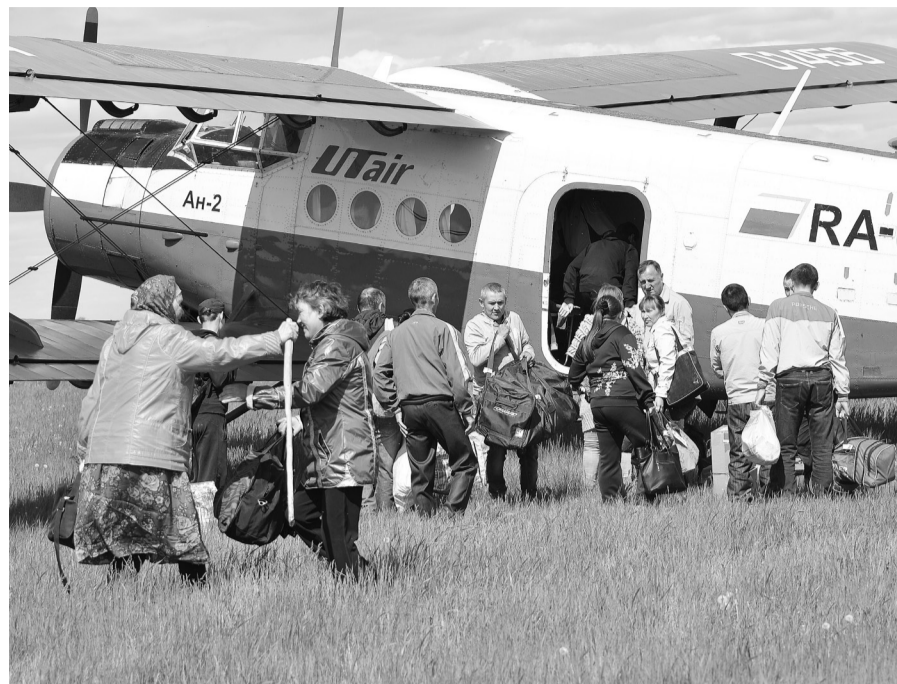
Кто-то приземлился, а кто-то только готовится к посадке.

Нам бы своё дело наладить – меня давно манит перспектива создания нижнетавдинской авиалинии. Есть