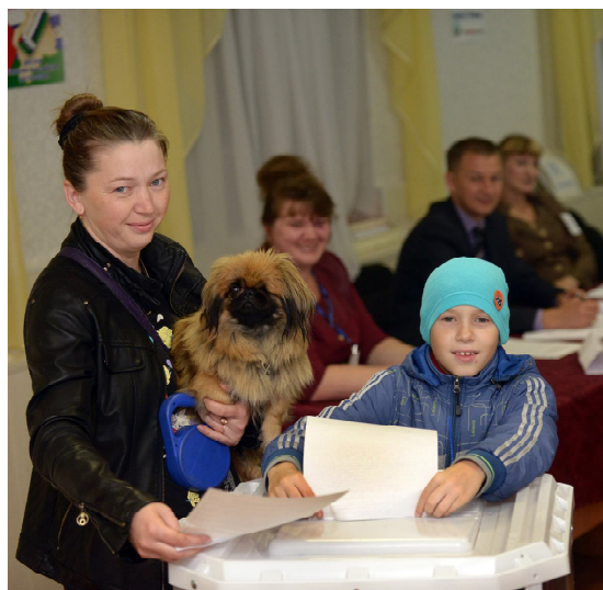
На избирательный участок всей семьей