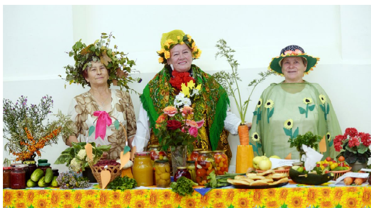
«Золотая осень» - милости просим!