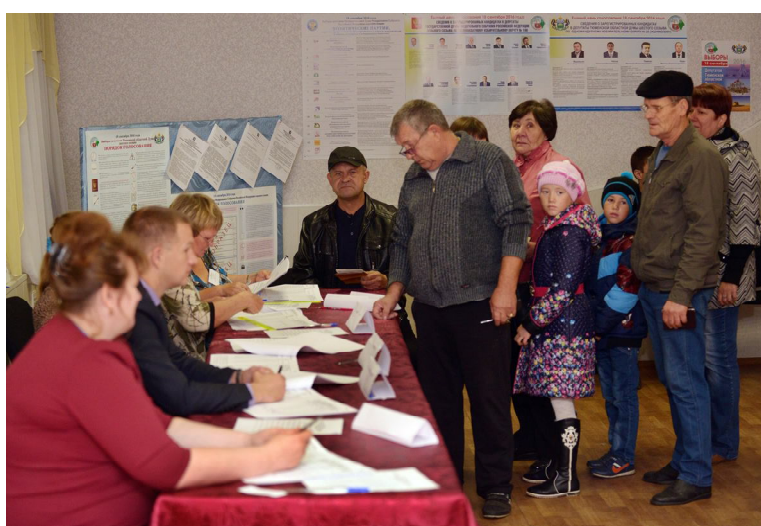
Избиратели получают бюллетени