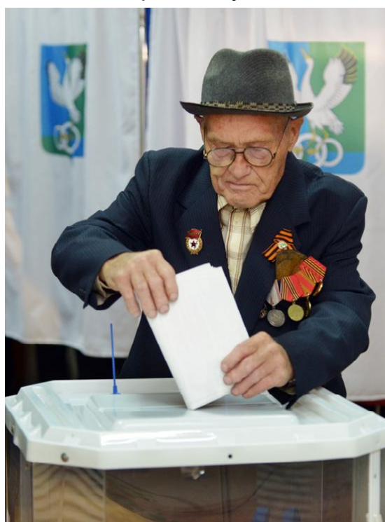
Ветераны в первых рядах избирателей