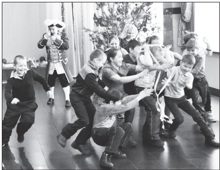
Эстафета для юных пиратов.

Работники культуры, спорта и Центра реализации молодёжных программ не дают нашим ребятам скучать. С 9 по 11 января в селе Упорово проходили новогодние туры «Рождественские приключения» для детей, проживающих на территории муниципального района.