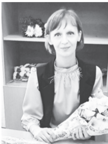
|| Фото из личного архива Ирины Пугачёвой

Помимо уроков Ирина активно занималась спортом, участвовала в художественной самодеятельности и обще-