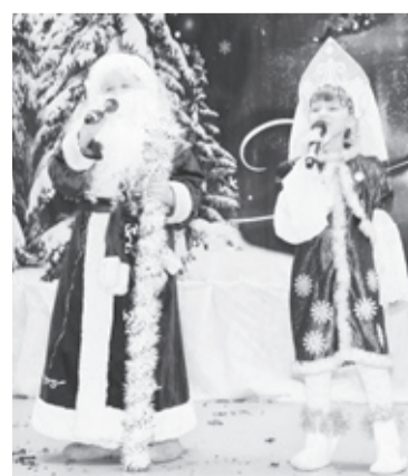
|| Моменты конкурса.