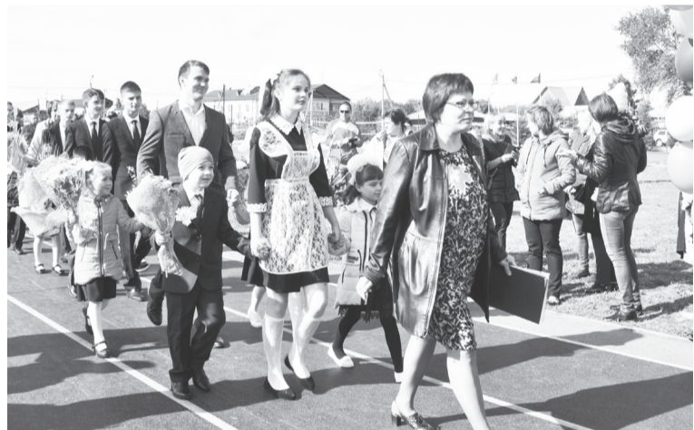
Ежегодно школы встречают первоклассников.

нравственных ценностей народов России, исторических и национально-культурных традиций. Основные показатели реализации проекта будут достигнуты к 2024 году. Проект предполагает реализацию четырёх основных направлений: обновление его содержания, создание необходимой современной инфраструктуры, подготовка соответствующих профессиональных кадров, их переподготовка и повышение квалификации, а также создание наиболее эффективных механизмов управления этой сферой.