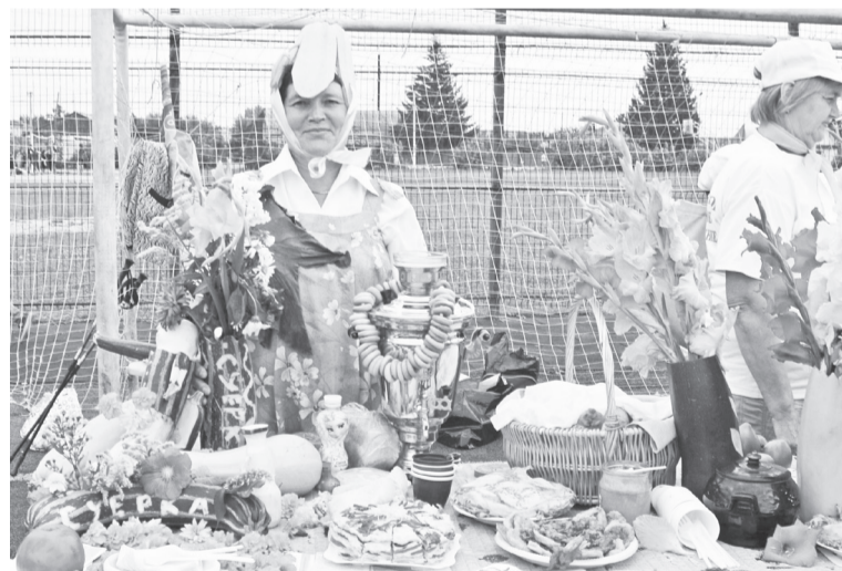
Суерцы удивили судей богатым столом и костюмом кабачка.

На спортивной полосе препятствий, к сожалению, не очень активными были на этот раз мужчи-