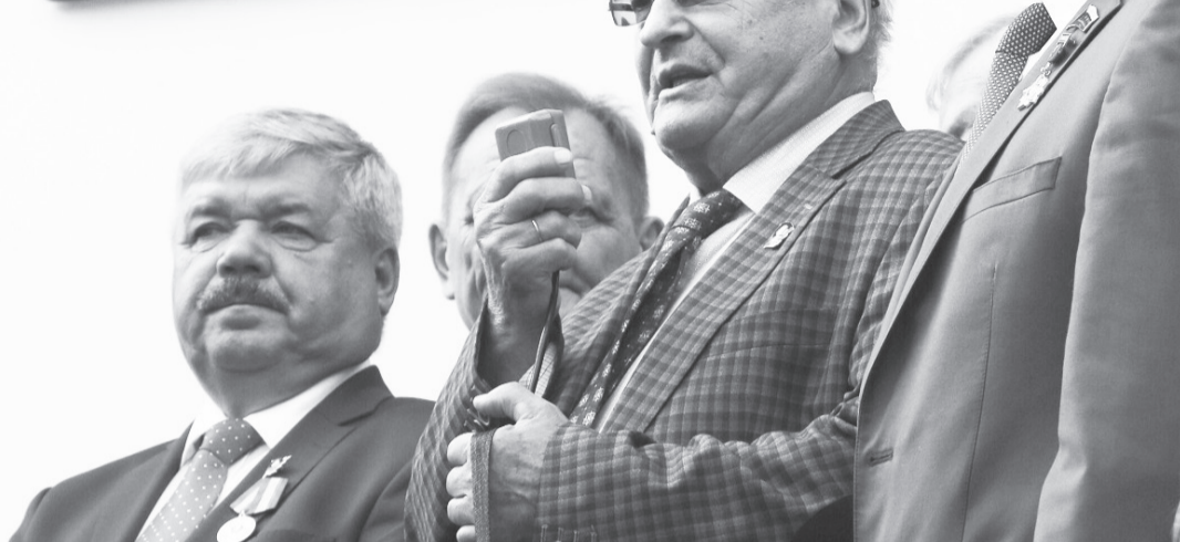
Во время церемонии открытия одной из мемориальных досок.

который был установлен на Привокзальной площади областного центра в год столетия ВЛКСМ в 2018 году, ветераны-комсомольцы торжественно открыли информационную плиту, рассказывающую о награждении Тюменской областной комсомольской организации орденом Трудового Красного Знамени. Это знаковое событие состоялось в апреле 1974 года.