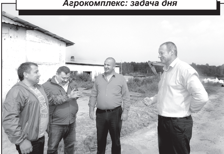
На Заозёрской ферме молочного направления

Похоже, юргинцы получат к зиме уникальный подарок – Заозёрскую ферму молочного направления для двухсот породных коров. Многие даже не слышали о том, что в деревне, неподалёку от Юрги, откуда давно ушло животноводство, отстраивается современное здание коровника, офис производственного сельхозпредприятия, ведётся разработка заброшенных земель и их ввод в оборот.