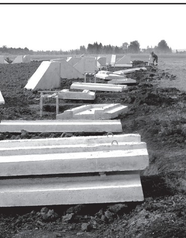
Смежное строительное производство – бетонный завод

Сегодня все вопросы, связанные с инвестиционным проектом, решаются в рабочем порядке с департаментом инвестиционной политики и государственной поддержки предпринимательства Тюменской области. Конструктивный диалог сложился с администрацией Юргинского муниципального района.