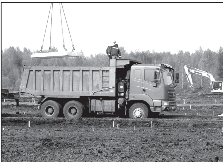
Строительство комплекса по выращиванию индейки идёт полным ходом