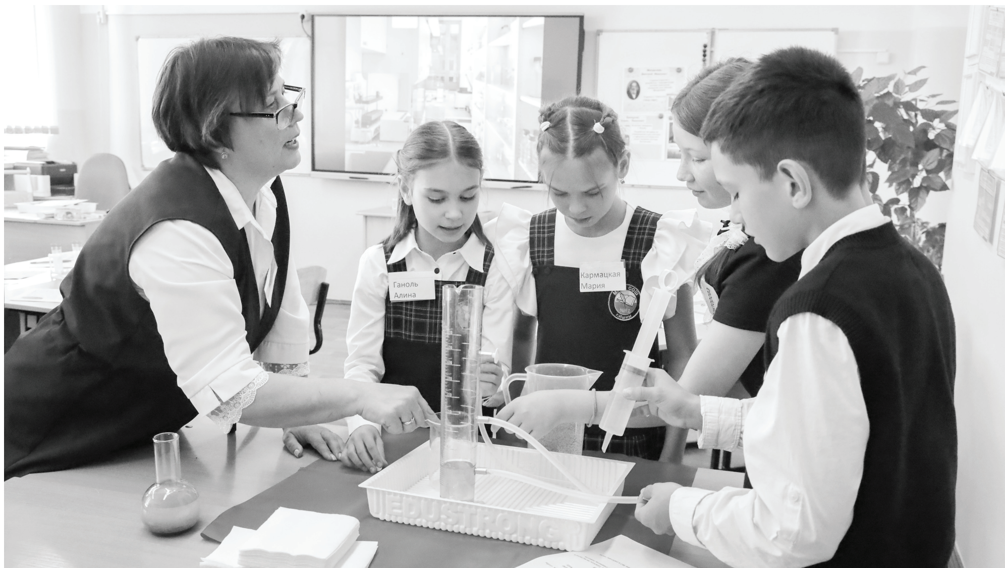
В Ишиме сегодня обучением детей занимаются 634 педагога, и каждый достоин высоких похвал за свой труд.