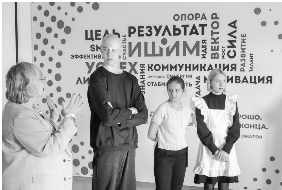
Профессия учителя востребована во все времена. Интерес к педагогике проявляют и нынешние старшеклассники.