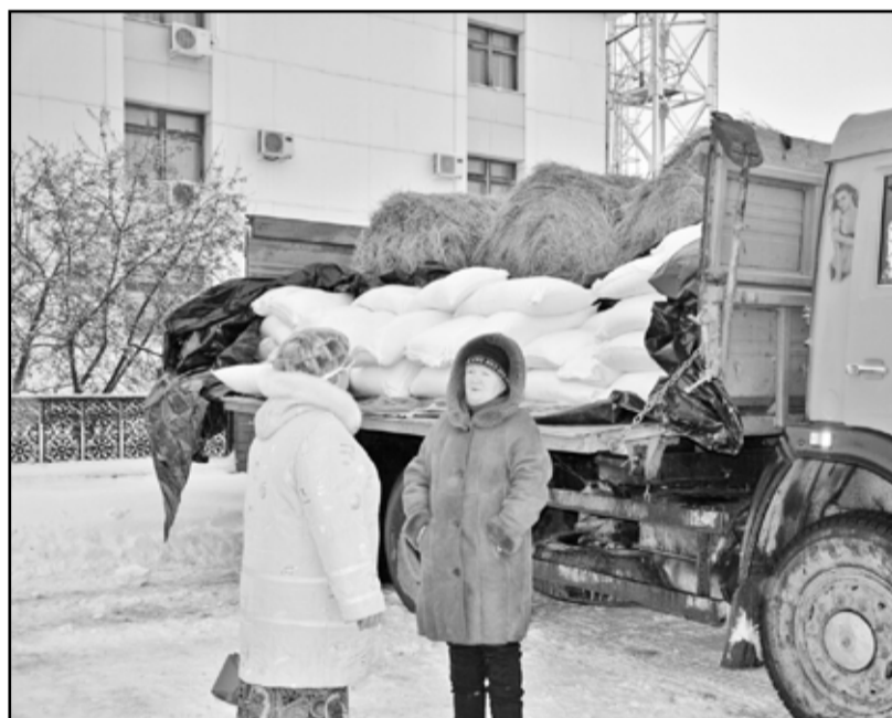
Жаль, что мука продавалась только в мешках по 50 килограммов. Покупатели предложили товаропроизводителю расфасовать продукцию по небольшим упаковкам