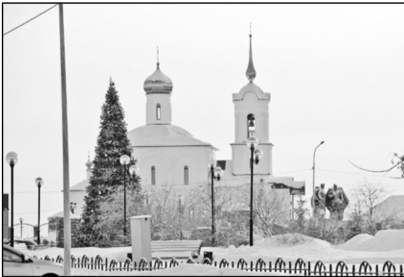
И зимой, и летом душа тянется в храм

11.00 – Рождественский концерт в детской школе искусств.