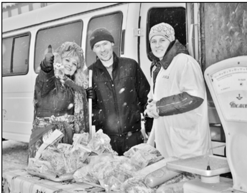
Представители агрофирмы «Новоселёв» – предприятия, занявшего первое место среди сельскохозяйственных товаропроизводителей

Угодили покупателям продавцы мяса. От этой продукции столы торговых палаток, как говорится, ломались. Пользовались спросом говядина и свинина как с личных подворий, так и от сельхозтоваропроизводителей и от предприятий переработки. Мясной продукции в этот раз хватило всем. Приятно поразило казанцев изобилие рыбы, птицы, северных ягод, восточных сладостей, хлебулочных изделий, мёда, ёлок и многого другого. Стоит отметить, что в один миг раскупили сено, которым на ярмарке торговали представители ЗАО «Агрокомплекс «Маяк».