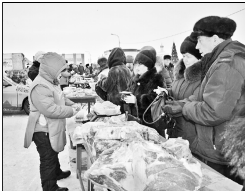
Мясом на предновогодней ярмарке можно было запастись на несколько месяцев

Они же торговали мукой высшего сорта, которую сельхозпредприятие производит на собственной мельнице. Кстати, муку и сено покупателям отвозили до дома. Маяковскую продукцию казанцы знают не понаслышке, поэтому от покупа-