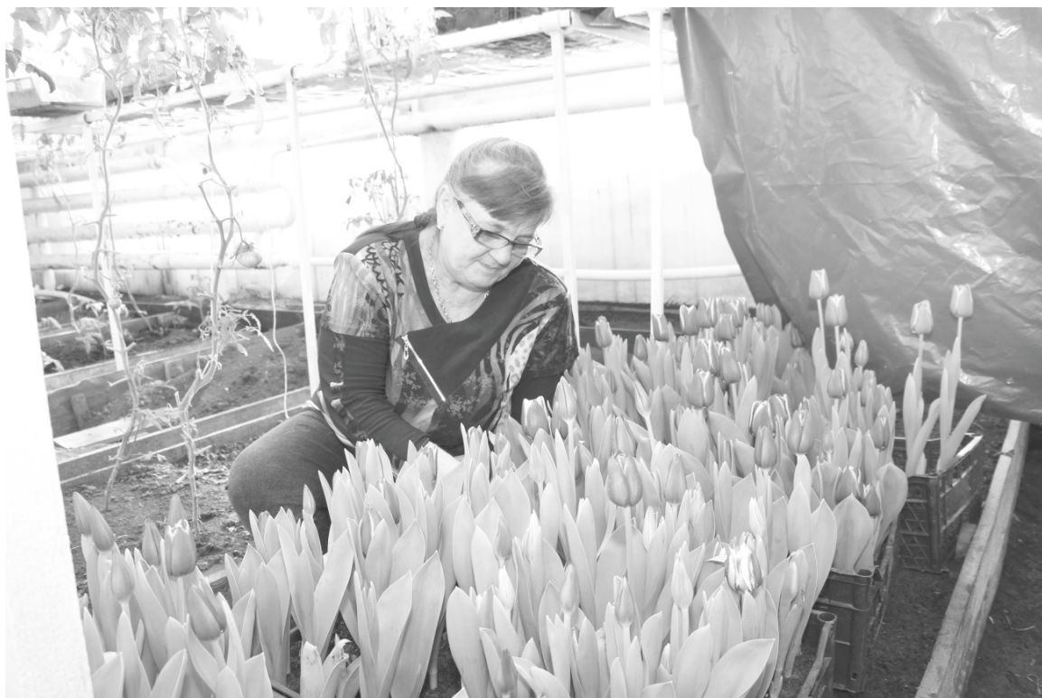
Тюльпаны любят тщательный уход и заботу.

В теплице коммунального хозяйства выращивают весенние цветы