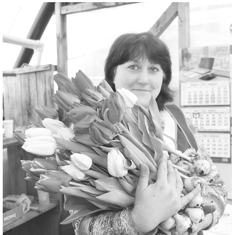
Очередная партия цветов готова для покупателей.

– Тюльпаны любят прохладу и затенённые места. Почва