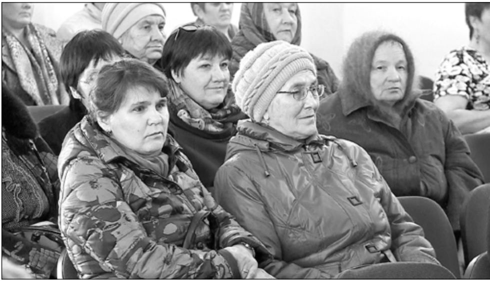
Больше тридцати вопросов задали на сходе черемшанцы