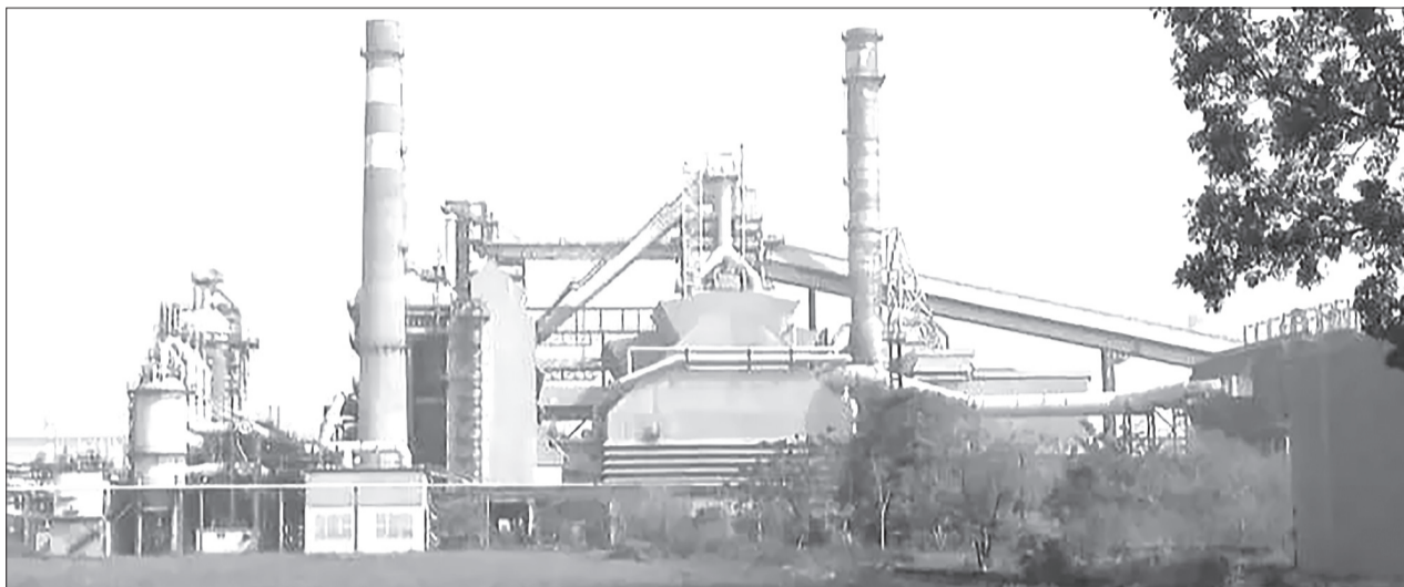
Аджакутский металлургический комбинат, построенный на территории площадью 24 000 гектаров, с 1979 года был крупнейшим сталелитейным заводом в Нигерии

Здесь климат иной. Работать приходилось много, да ещё при такой жаре. Правда, электрикам было немного легче в этом плане, потому что они трудились в уже возведённых помещениях. Другие же специалисты целыми днями находились под палящим солнцем. Конечно, многие болели. Особенно страшно было подцепить тропическую лихорадку или малярию. Для профилактики выдавали таблетки, которые иногда приходи-