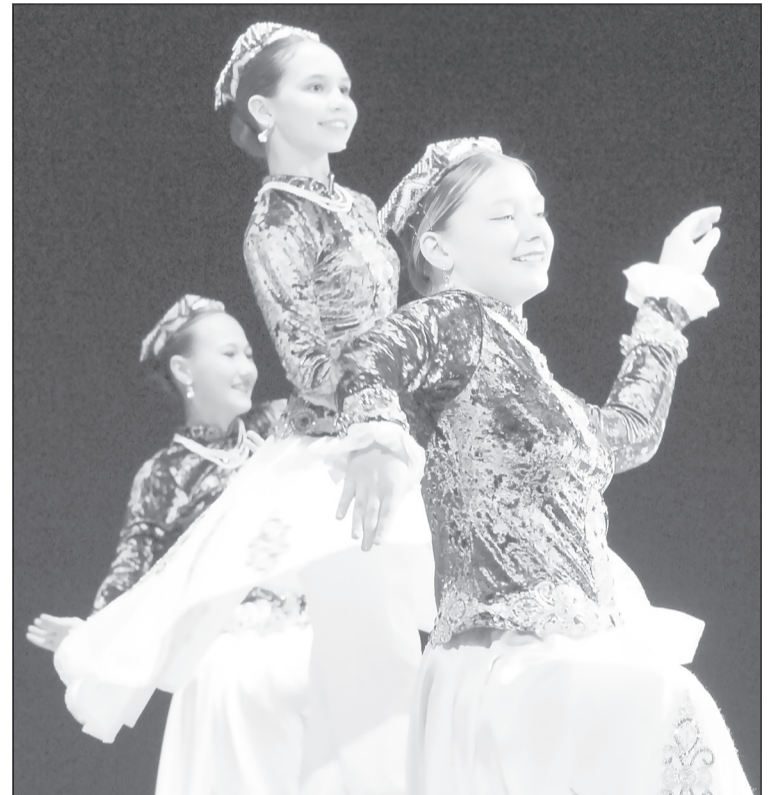
Одним из самых ярких стало хореографическое направление. В этом году коллективы представили очень много национальных танцев

■ Состязания по многим конкурсным направлениям, например вокалу и хореографии, длились непрерывно с утра до вечера