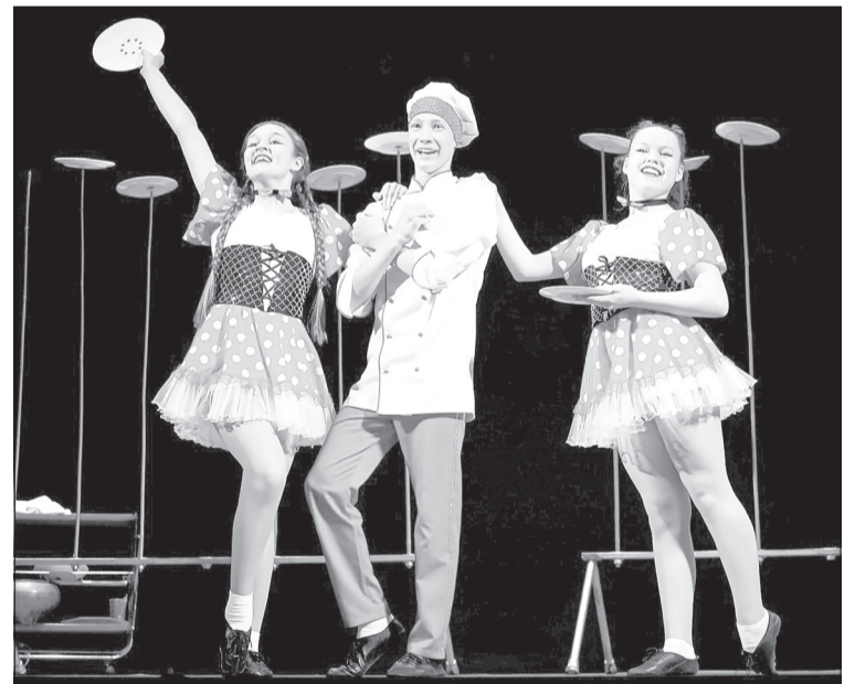
Среди циркачей победу одержал тюменский коллектив «Икар»